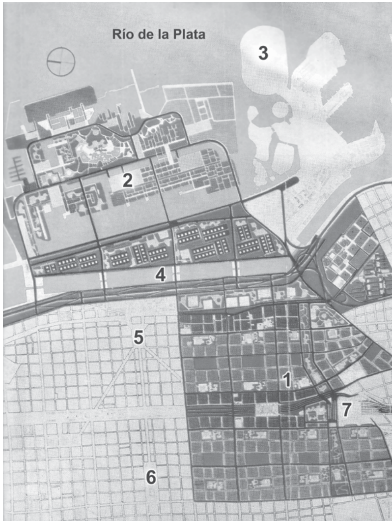
Figura 3 Redes de vinculación externa.

de diseño según una importante valorización particular del área, fundamentados en los siguientes criterios: