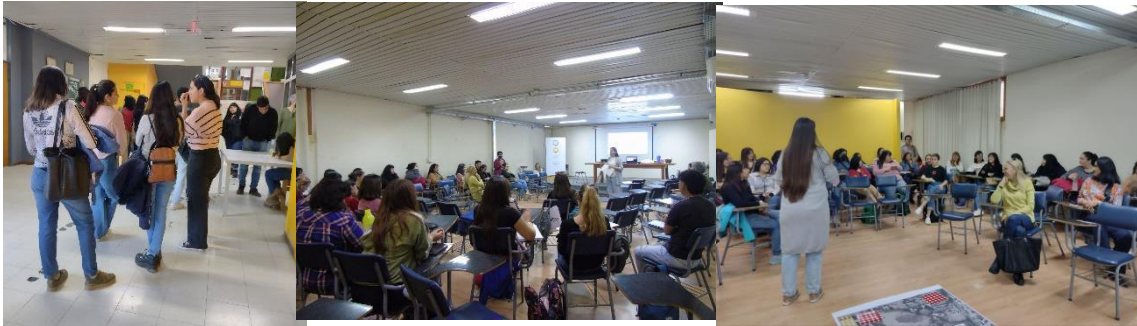
Figura 6: Presentación Marcha exploratoria. Sala de teleconferencias FAUD.

En un segundo momento, en grupos de quince a veinte personas, se llevó a cabo el recorrido por cada uno de los itinerarios propuestos. El grupo número uno recorrió espacios comunes del ala este de la Facultad de Ciencias Sociales (FACSO), los patios traseros de los talleres del departamento de arte de la Facultad de Filosofía, Humanidades y Artes (FFHA) y la fachada norte de la Facultad de Ciencias Exactas, Físicas y Naturales (FCEFN). Este grupo inició y finalizó en el mismo punto de encuentro situado en el acceso principal del complejo que es a su vez el ingreso de la Facultad de Ciencias Sociales, citado sobre Avda. Ignacio de la Roza.