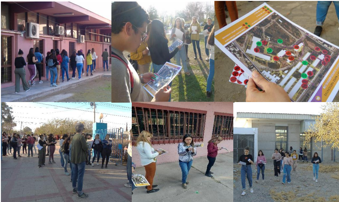
Figura 7: Marcha exploratoria, muestra de los tres recorridos.

Mientras transcurría la marcha en los diferentes grupos, se observó que la gran mayoría comentaba situaciones de peligrosidad en distintos niveles en varios puntos claves del recorrido, caminar con la intención de observar y sentir le impregnó otro sentido del que se hace cotidianamente, para ir a trabajar o estudiar. En algunos casos particulares comentaron experiencias propias y extrañas de gente que experimentó momentos de vulnerabilidad que atentaban a su integridad física, psíquica y emocional, también se sumaron los comentarios referidos a percepciones de inseguridad al transitar por in tercsticios desolados, en algunos casos sin equipamiento, sin iluminación o en estado de abandono. Otro factor común fue el reconocimiento de sitios del complejo, de los cuales desconocían su existencia hasta ese momento. Más allá de volcar todas estas sensaciones en sus registros, el grupo de m onitoras tomaron notas sobre situaciones particulares que lo ameritaba y también para tener en cuenta con vistas de mejorar la metodología en las próximas marchas.