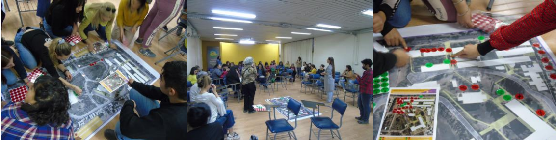
Figura 8 Mapeo participativo en la sala de teleconferencias FAUD.