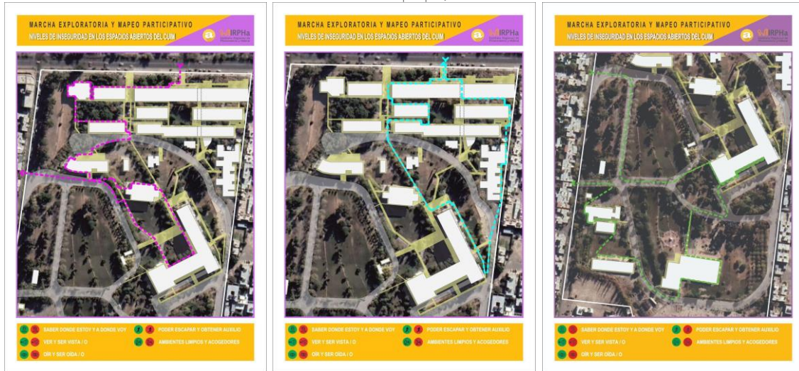
Figura 2: Pieza gráfica comunicacional para los recorridos de reconocimiento.

Para facilitar la identificación de las problemáticas en función de las características espaciales existentes, se realizó una abstracción gráfica de los principios METRAC a través del diseño de pictogramas que referencian en rojo, aquellos principios que son afectados y en verde aquellos que suceden sin condicionantes. Estos pictogramas fueron impresos en vinilo adhesivo, para que cada participante de la marcha exploratoria pudiese con un sticker, señalar cada uno de los sitios inseguros en su mapa.