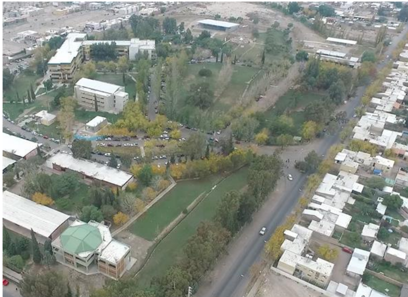
Figura 1: Vista aérea del Complejo Universitario Islas Malvinas.

El complejo universitario, que fue definido como área de estudio, está ubicado en el departamento Rivadavia de la provincia de San Juan, sobre calle Av. José Ignacio de la Roza Oeste y calle Meglioli, cuenta con una superficie cubierta de aproximadamente 152.576m 2 . En él se ubican las instalaciones de la Facultad de Arquitectura, Urbanismo y Diseño (FAUD); de la Facultad de Ciencias Sociales (FACSO), de la Facultad de Ciencias Exactas, Físicas y Naturales (FCEFN) y el Departamento de Arte de la Facultad de Filosofía, Humanidades y Artes (FFHA) de la UNSJ.