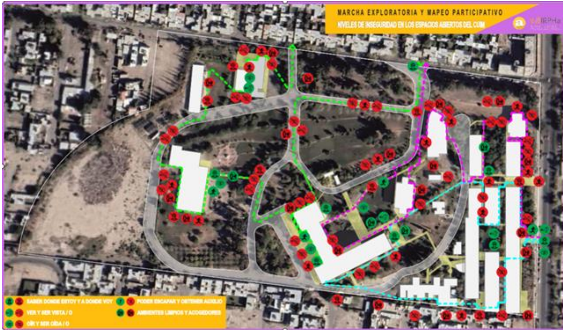
Figura 9: Resultado síntesis.