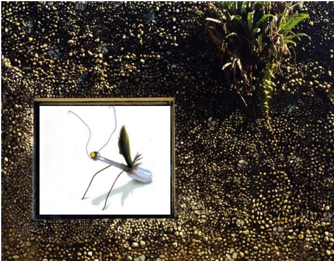
Figura 2: Collage de la autora con dos obras de Lina Bo Bardi : Insecto (1957) sobre la ventana de la Fachada de la Casa Valéria P. Cirelli , São Paulo (1958).