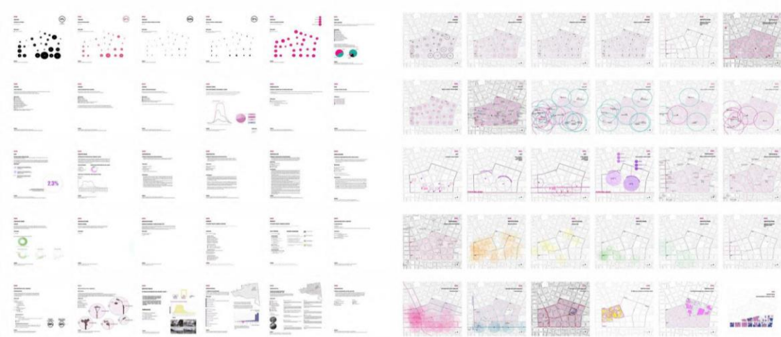
Figura 2: Datea! Selección de trabajos de estudiantes.