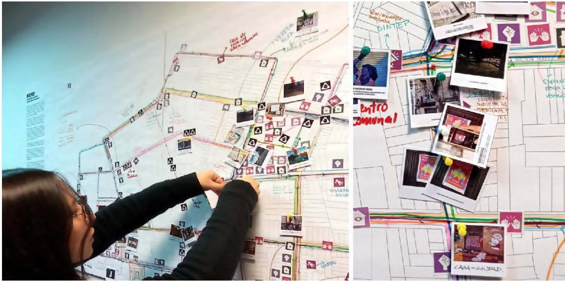
Figura 4: Mapeo colectivo realizado en encuentros posteriores a la Deriva.

participados. Las distintas estrategias derivaron en entrevistas, encuestas en sitio o web, observaciones participantes, marchas exploratorias, registros diversos y mapeos en el ámbito, entre otros.