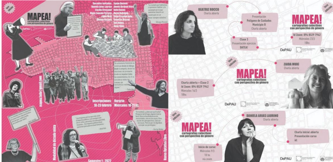
Figura 1: Placa de presentación del curso y referentas. | Placas de difusión de las charlas abiertas 2022.