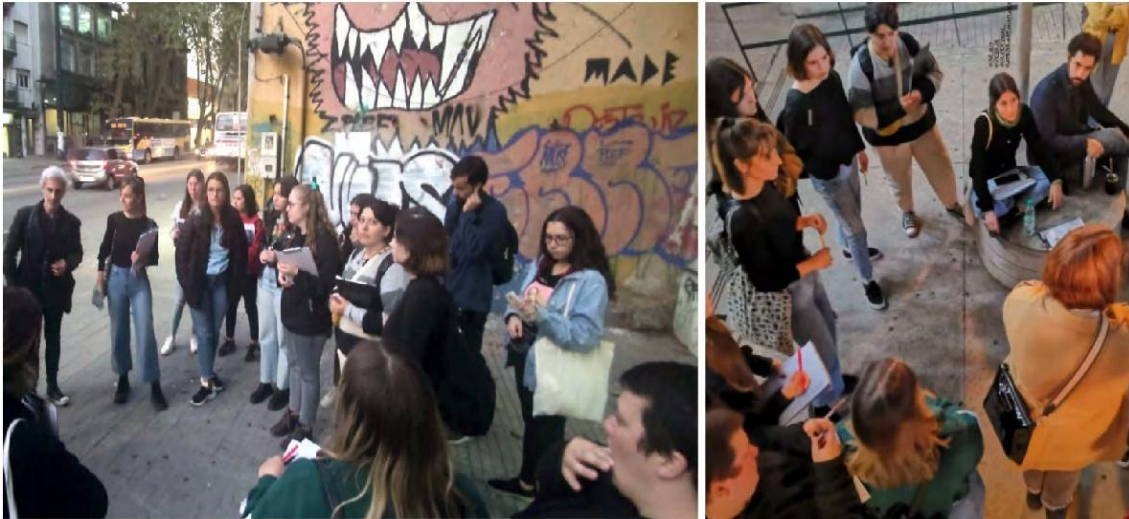
Figura 3: Deriva! Recorrido colectivo por el polígono de cuidados del Municipio B realizado el 27/04/2022.

Durante la deriva se realizaron individualmente, a modo de consigna, capturas fotográficas espontáneas, notas, observaciones y registros diversos de estas experiencias personales. Estas primeras impresiones del territorio desde la experiencia de la deriva se registraron en una única lámina individual, un mapa que paso a paso se completó in situ con percepciones propias de la experiencia personal durante el recorrido.