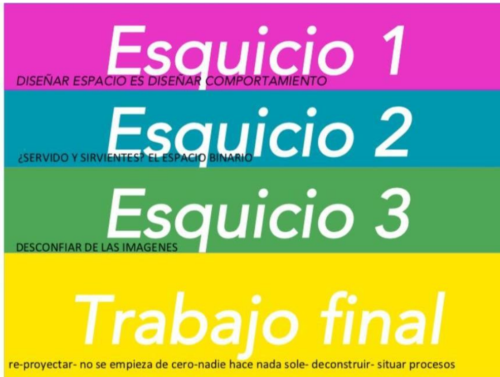
Figura 2: programación del taller.

A esta estructura, se sumó una instancia de apertura y cierre en el primer y el último día, respectivamente: la presentación “de-construcción colectiva” y “lo que el taller nos dejó” en la finalización.