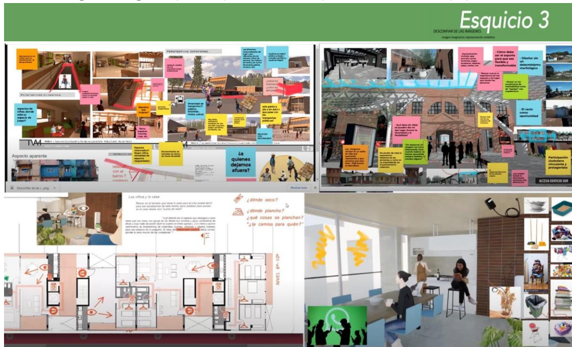
Figura 8: Collage de capturas de pantalla del taller, esquiso 3.

Indagar sobre la imagen implica también asumir la producción detrás de una construcción. Desde una perspectiva de género es fundamental la integración de mujeres y diversidades a la producción y construcción, promoviendo saberes y oficios históricamente masculinizados. Citamos ejemplos de autoconstrucción y cooperativas de vivienda, uno de ellos fue el caso de Ellas Hacen, un programa de desarrollo social nacional orientado al cuidado y capacitación en oficios de la construcción de mujeres solas, con hijos a cargo y víctimas de violencia de género para su inser