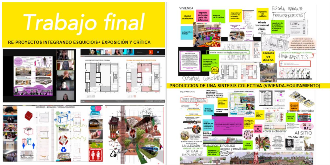
Figura 9: captura de pantalla del taller, trabajo final.

Los temas desarrollados para el trabajo final agrupaban varias problemáticas abordadas en el taller, como la diversidad de usuarios, diversidad de asociaciones y usos, división sexual del trabajo y del espacio, las cuatro esferas de la vida cotidiana (Punt, Col-lectiu. "6, 2019) (productiva, reproductiva, personal y política), el ecofeminismo, la proximidad y la comunidad, las relaciones intergeneracionales, las clases sociales y sus modos de habitar y apropiarse del espacio y los modos cooperativos, entre otros.