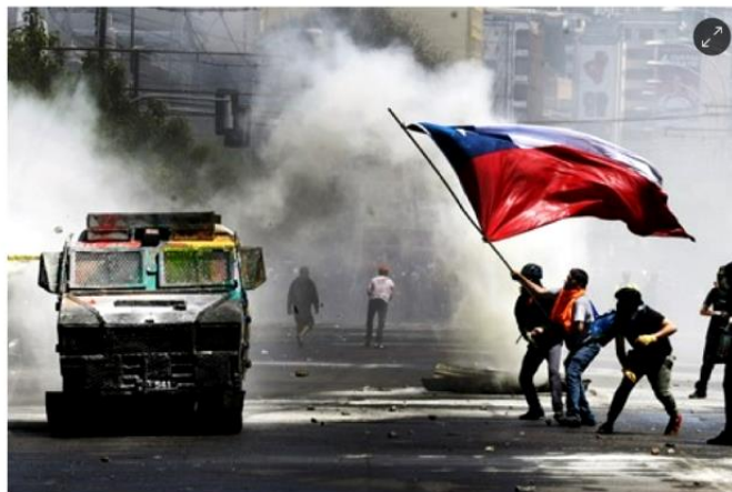
Manifestantes ondean una bandera chilena durante una protesta contra el Gobierno en las manifestaciones del 'estallido social' en el 30 de octubre de 2019.

Figura 3: Contexto post estallido social 18-O y Pandemia Covid-19.