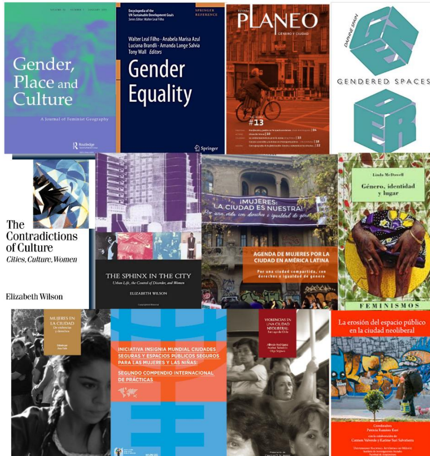
Figura 1: Ejemplos de lecturas de la bibliografía del curso.

La formación universitaria sobre género vinculado al campo disciplinar de arquitectura, diseño y urbanismo, se viene consolidando en los últimos años como asignatura específica en los programas académicos universitarios, incorporando una gran diversidad de enfoques multidisciplinares y de autoras.