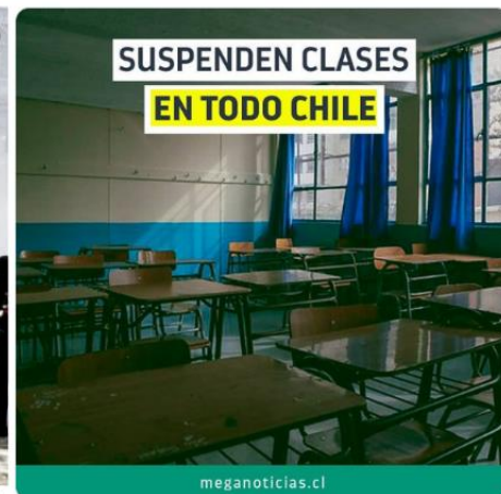
2:46 p. m. - 15 mar. 2020 - TweetDeck

Al ser un curso para toda la universidad, la modalidad virtual permitió contar con una mayor diversidad disciplinar estudiantil, sin limitarse a la misma facultad o facultades cercanas e incorporando a estudiantes que se encontraban fuera de Santiago por la pandemia. Se utilizó la plataforma virtual Canvas para compartir bibliografía, clases, grabaciones, trabajos y generar interacción mediante foros semanales. Además, el programa incluyó clases sincrónicas complementadas con actividades asincrónicas, dando mayor flexibilidad a la carga académica en un contexto de crisis social, sanitaria y de salud mental.