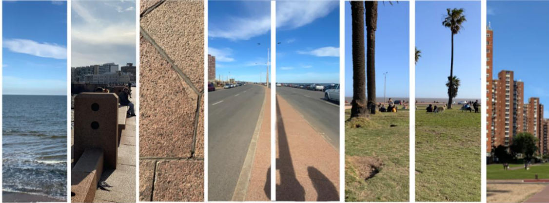
Figura 3. Conformación de Rambla Sur.

Cómo generamos un campo teórico de análisis ¿dónde está la percepción? ¿qué percibimos? ¿cómo se cuantifica? ¿cuáles son los parámetros de percepción vinculados al bienestar?