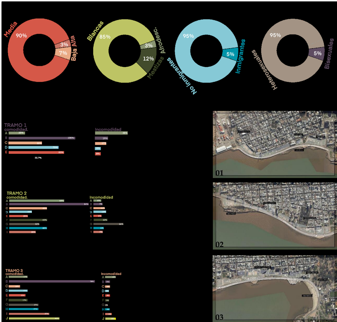
Figura 4. Resultados Encuesta Rambla Sur desde una perspectiva de género. Visión interseccional.