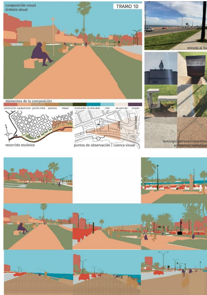
Figura 5. Análisis visual y Síntesis visual atributos positivos.

Estos análisis permitieron realizar inferencias sobre las claves de la perspectiva de género en el paisaje utilizando los datos recopilados.