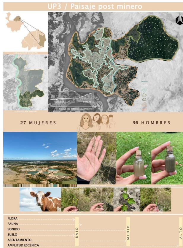
Figura 3. Ficha técnica

enfocada principalmente en mapear a las mujeres, una breve valoración del paisaje con componentes fundamentales para comprenderlo sobre la flora, fauna, sonido, el relieve, suelos, y amplitud escénica, una colección de paisaje con trozos o fragmentos del territorio que pueden dar indicio del recurso paisajístico, por último una fotografía de la UP que da constancia de las cualidades estéticas, de forma y color frente al diseño y la percepción del paisaje.