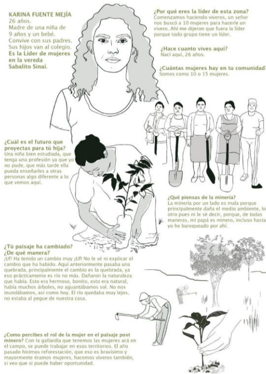
Figura 4. Única entrevista

Por último, el territorio del bajo cauca antioqueño ha sido un lugar que en el tiempo se ha caracterizado por dominar unas doctrinas sociopolíticas informales, las cuales en este caso contribuyeron probablemente a que la información primaria (Entrevistas, fotografías, conversaciones, dibujos...) frente al trabajo de campo desde lo social, no haya sido de fácil acceso; es así como esta investigación realiza una única entrevista a una una de las líderes de la comunidad de Sabalito Sinaí, debido a que fue la única persona que accedió a conversar en esta visita a la comunidad. Esta entrevista semiestructurada consta de una serie de preguntas que finaliza con una interacción gráfica, la persona interesada concede dibujar a su manera el paisaje que percibe en su cotidiano vivir. Esta entrevista tuvo lugar en la vereda Sabalito Sinái del municipio de El Bagre, con una duración aproximada de 10 a 15 minutos.