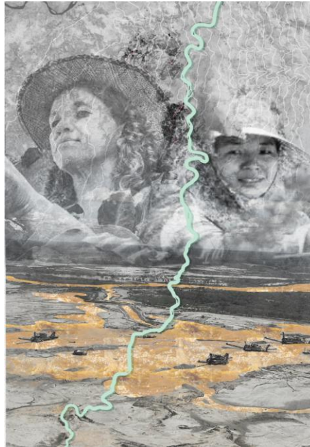
Figura 2. El paisaje desde una mirada de género

Es la tercera subregión más grande de Antioquia. Su extensión es 8.484 km 2 y representa el 13,5 % de la superficie del departamento. Se compone de seis municipios, cuatro de los cuales representan gran parte de la producción de oro antioqueña: Caucasia, El Bagre, Tarazá y Zaragoza. Se acotará este estudio en el municipio de El Bagre, responsable junto con el municipio de Zaragoza del 41,75 % de la producción departamental y 19,05% de la producción nacional de oro (Arcos Alonso & Rivera Guzmán, 2018. P.38).