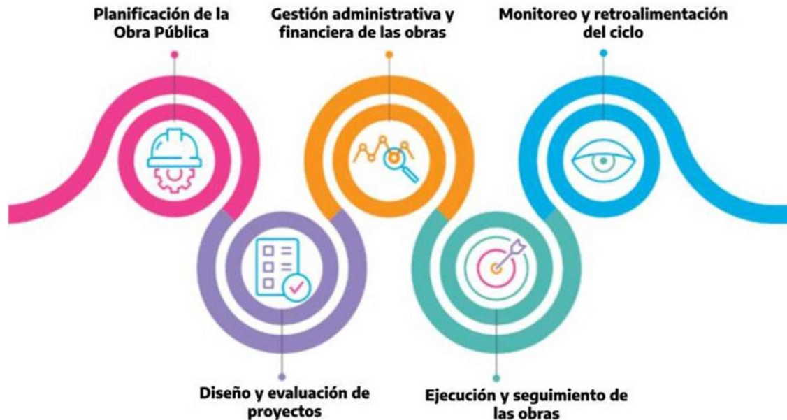
Figura 2: Gráfico extraído del manual “La perspectiva de género en el ciclo de la obra pública”