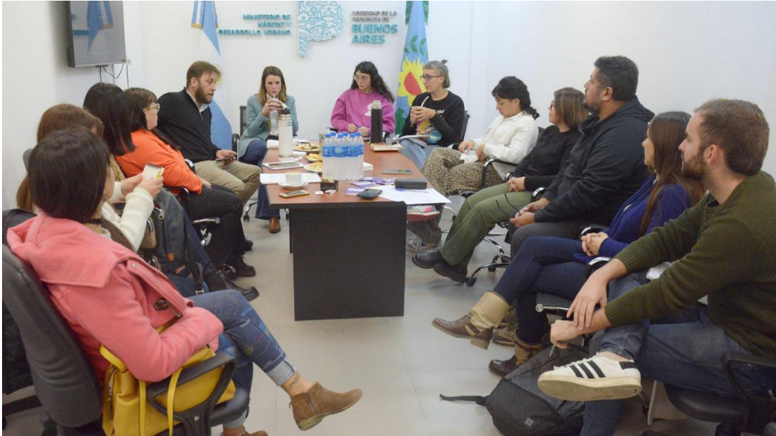
Figura 5: Fotografía de la primera mesa de trabajo "Lohana Berkins"