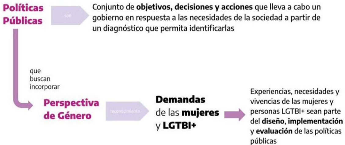
Figura 1: Producción propia para Capacitación en Ley Micaela

Para comenzar, nos parece importante definir qué significa para nosotrxs transversalizar la perspectiva de género en el Estado. Podemos entenderla como el procedimiento mediante el cual los derechos de las mujeres cis y las personas LGTBI+ se traducen en acciones concretas, orientadas a garantizar su sostenibilidad a lo largo del tiempo y su institucionalización.