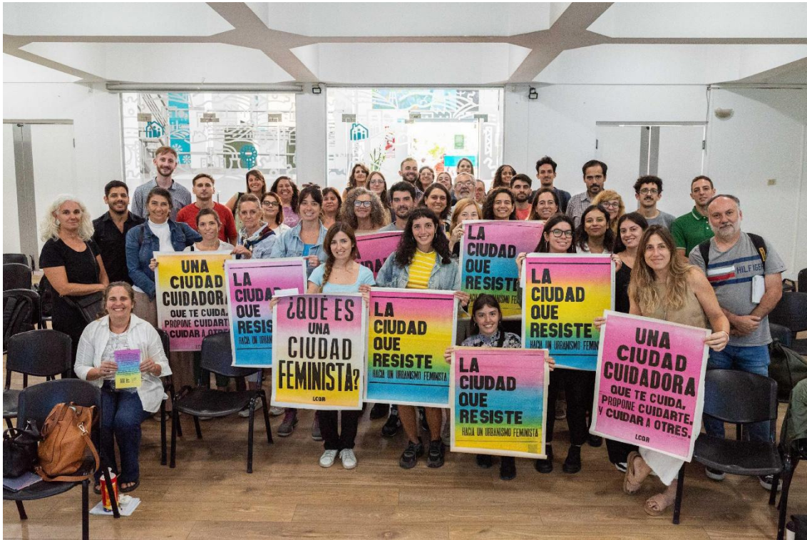
Figura 4: Fotografía del encuentro "Hacia un urbanismo con perspectiva de género"

También estamos trabajando con el Ministerio de Mujeres y Diversidad de la PBA en la creación de indicadores de presupuesto con perspectiva de género. Para ello, hemos comenzado a etiquetar los proyectos en función de diversas dimensiones clave, tales como tiempo y cuidado, brecha de empleo, brecha de ingresos, prevención de las violencias, y transversalización de la perspectiva de género.