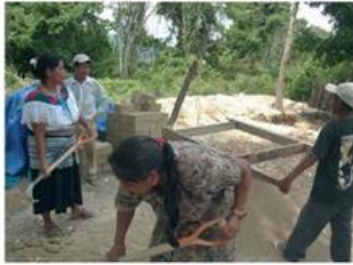
Figura 2. La participación comunitaria en el proceso de construcción de la clínica de salud en la comunidad de San Juan de los Ríos, en el departamento de Cauca, Colombia. El proceso de construcción de la clínica de salud en la comunidad de San Juan de los Ríos, en el departamento de Cauca, Colombia.

Gracias al diálogo permanente que tuvimos en las asambleas con el pueblo, al uso de la prensa que compacta la tierra y a los distintos procesos que realizamos con los bloques in situ, su tierra finalmente los inspiró confiar.