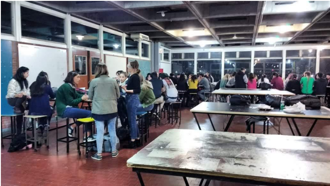
Figura 5: Taller de diseño gráfico (FADU:UBA).

El debate posterior a la proyección del film constituye el cierre del taller. Algunos comentarios surgidos fueron “Está bueno que muestren los dos lados de lo que pasa porque me parece que te da lástima el hombre y cuando le pasa a la mujer parece que es lo más normal” o “Es lo que le pasa a la mujer todo el tiempo en realidad”.