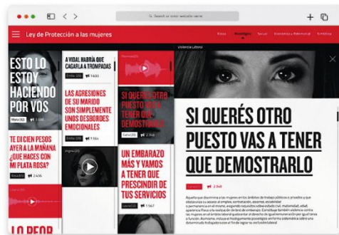
Figura 1: Trabajos prácticos finales de estudiantes de Diseño Gráfico 3 "Diseño de Interfaces Interactivas de Información".

El objetivo de esta página es informar y dar ayuda a mujeres que sufren violencia de género . Además, generar conciencia en la gente. Optamos por armar un Home que llame la atención del usuario a través de testimonios y