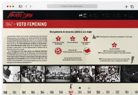
Diseño de una experiencia interactiva de información sobre el aborto y salud reproductiva basado en el documento «Aborto en Argentina: Síntesis de su historia legislativa» que describe cómo a partir de la entrada en vigencia del