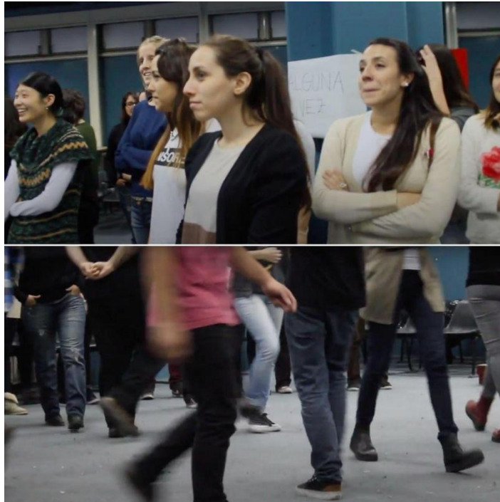
Figura 2: Dinámica de las cuatro esquinas..

Las talleristas abrieron preguntas a todes para pensar “¿por qué creen que se producen esas diferencias?”, “¿a qué se deben los lugares en los que quedan ubicados mujeres y varones en las relaciones sociales?”. En las ideas que aparecieron subyace la noción de género, como algo histórico, cultural y que puede ser modificado.