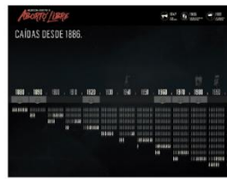
Código Penal Argentino en 1887 y las subsecuentes modificaciones dadas tanto en gobiernos constitucionales como dictatoriales se desarrolla la historia de la legalidad del aborto en el país.