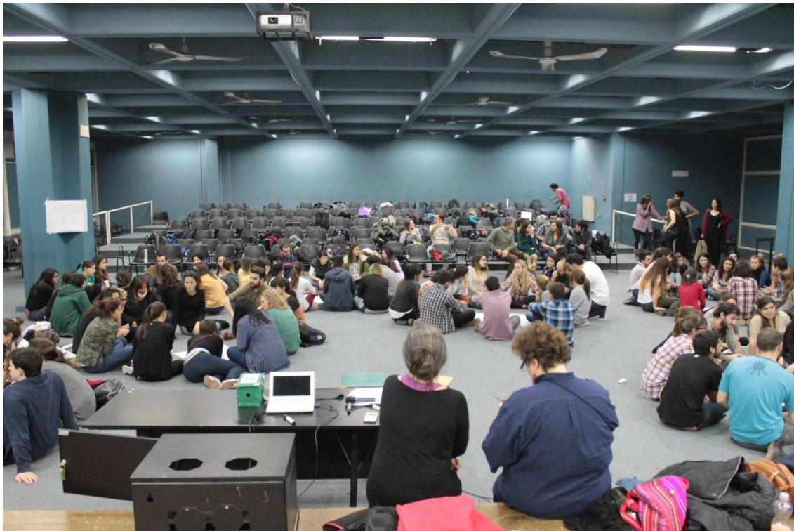
Figura 3: Dinámica de dibujo en el taller..

imperante. Preguntas como “¿cómo debe ser una mujer y cómo debe ser un varón?”, “¿qué cualidades son bien vistas para ser mujer, qué cualidades son necesarias para ser reconocido como varón?”, “¿cuáles son esas cosas que el orden social nos indica de cómo debemos ser, qué espacios debemos visitar, qué ocupaciones tenemos que tener?” fueron las disparadoras para que los estudiantes comenzaran a dibujar los papeles afiche que se dispusieron en el piso del aula (ver Figura 3).