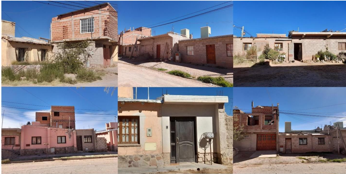
Figura 3. Fotografías de diferentes viviendas de los conjuntos, con sus modificaciones e incorporaciones.

Sobre este punto, dos cuestiones permiten indagar desde la tensión entre la función y el uso, entre la mirada funcionalista de la arquitectura disciplinar y el campo de lo vernáculo. Tal como ha sido observado en distintas investigaciones (Gobel 2002, Tomasi 2011, Barada 2018) la conformación de la casa, en el contexto andino, está asociada a la adición sucesiva de recintos, denominados y concebidos, asimismo, como casas , cuyos roles no se definen desde la funcionalidad en las dinámicas cotidianas, aunque evidentemente las tengan, sino que forman parte un proceso continuo de constitución de la casa y entonces, de la familia (Tomasi, 2024). Los espacios, recintos, que fueron adicionados a las viviendas en los casos estudiados establecen una relación con esta noción de casas , puesto que, en términos materiales no se integran de manera directa con la espacialidad de la vivienda, conservan sus accesos independientes entre sí, y, a su vez, forman parte, en general, de una progresiva independencia por parte de los hijos e hijas, ya mayores, que continúan viviendo con sus madres y/o padres. En este sentido, se da una doble relación entre la producción de nuevos recintos cuyo sentido en el devenir familiar está claramente definido, y que, a su vez, poseen funcionalidades más bien flexibles. A mismo tiempo, las habitaciones de la vivienda, proyectadas para el descanso de los miembros de la familia, se constituyen, en ciertas ocasiones,