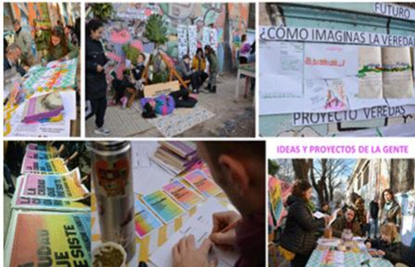
Figura 7. Activaciones Barrio Mondongo.

En abril de 2023, se retomaron las actividades iniciadas en 2021, dando inicio a una serie de encuentros orientados a la organización, gestión y planificación de las Etapas 4 y 5, en los que participaron el equipo extensionista, los espacios culturales del eje El Mondongo y otras organizaciones colaboradoras. Entre las tareas de organización destacadas, se gestionó la poda de raíces y copas de 14 ejemplares de tilo, cuyas raíces habían causado el deterioro de la vereda. Esta intervención fue realizada con la colaboración de la Secretaría de Espacio Público y la Dirección de Arbolado Público de la Municipalidad de La Plata.