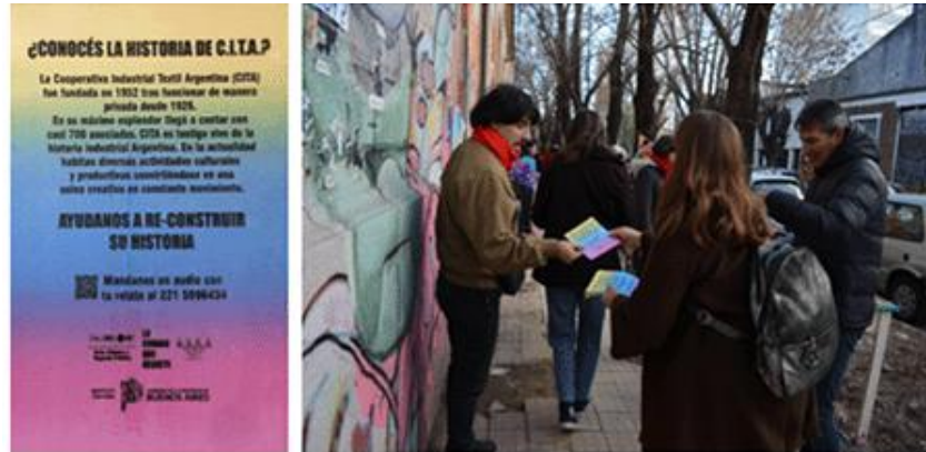
Figura 8. Eje pasado.

De manera complementaria, se preparó una breve historia de la cooperativa, que fue expuesta en la calle junto con material gráfico y fotográfico.