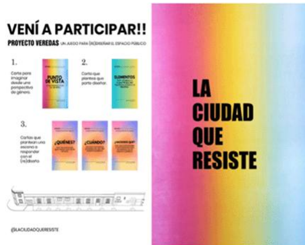
Figura 10. Eje Futuro.

El material recolectado durante esta jornada resulta valioso para el desarrollo de un diseño participativo, el cual será leído, clasificado e interpretado para ser transformado en un proyecto concreto para la vereda de la ex fábrica CITA.