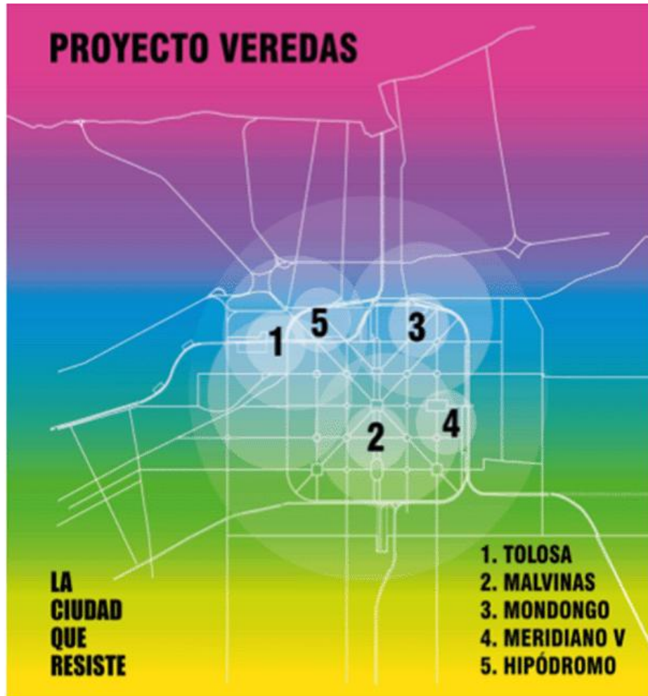
Figura 1. Barrios de intervención.