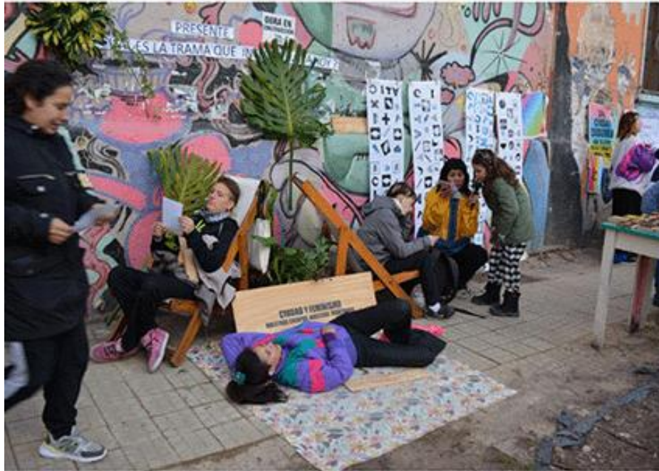
Figura 11. Activación de ACIADIP en la vereda de CITA.

La estrategia consistió en invitar a transeúntes, vecinos, participantes del evento y artistas a permanecer en el espacio público, promoviendo una ocupación compartida de la vereda de C.I.T.A. Se colocaron reposeras, mesas y sillas en la vereda, acompañadas de música, lecturas de manifiestos, carteles feministas y diversos objetos, creando un ambiente propicio para la pausa, la contemplación del cielo y la danza. Esta intervención buscó transformar la vereda en un espacio vibrante, integrando diferentes actividades simultáneas, como talleres temáticos (pasado, presente y futuro), entrevistas y una feria, para revitalizar el área.