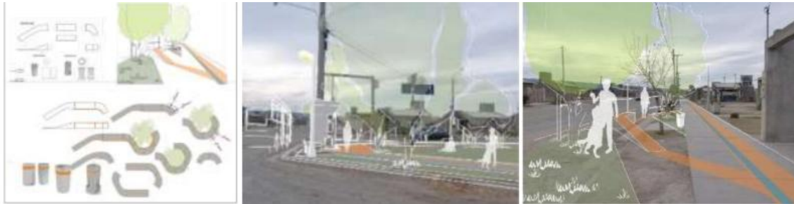
Figura 7: Propuesta de diseño del sendero de cuidado para el barrio Pie de Palo. 2024