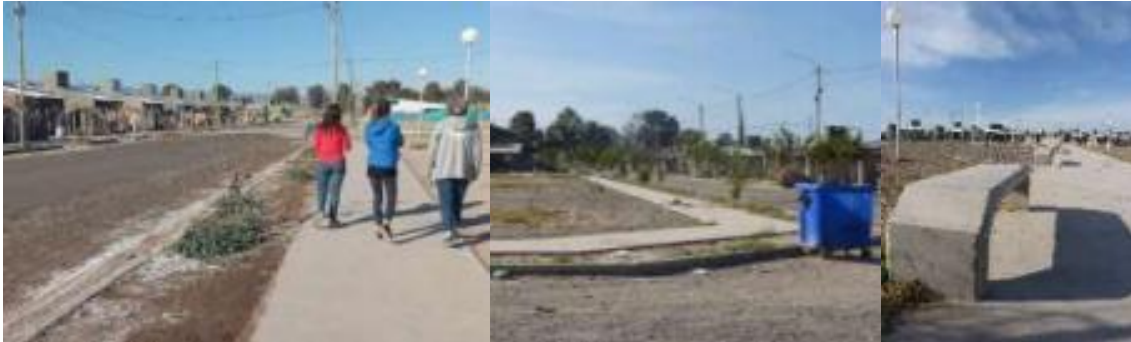
Figura 2: Imágenes del Barrio Pie de Palo en Caucete, San Juan.

La metodología propuesta contempló la participación directa de las mujeres en la elaboración del diagnóstico y las propuestas de solución. Por ello se realizó en una primera instancia un Taller de Sensibilización con el objeto de advertir los niveles de inseguridad que perciben las mujeres en el espacio público de su barrio (Figura 3). Se trabajó sobre interrogantes referidos a: ¿Cómo perciben el espacio público?, ¿Cómo y por dónde se mueven en el barrio? ¿Cuáles son sus opciones más seguras?, ¿Cuáles son sus condicionamientos para desplazarse?, entre otros. Paralelamente el taller estuvo complementado con actividades para las Infancias en el que se propició el reconocimiento y apropiación del espacio público barrial a través del juego, y se evidenciaron situaciones de violencia (Figura 4).