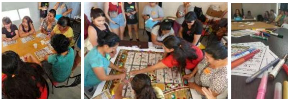
Figura 5: Taller de mapeo colectivo. 2024

A partir de este diagnóstico se propuso la definición de un “sendero de cuidado”, concebido como un recorrido pensado, planificado y diseñado dentro del espacio público de un barrio, que forma parte de una estrategia integral de seguridad para las mujeres. Se trata de un trayecto que une los espacios frecuentados cotidianamente, provisto de equipamiento y condiciones de