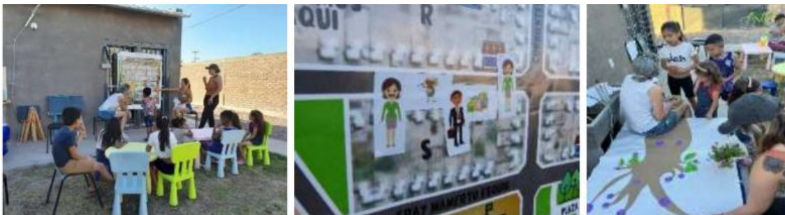
Figura 6: Espacio para infancias del segundo taller. 2024

seguridad específicas. Además, el sendero de cuidado resulta una oportunidad para la reflexión y toma de conciencia, en forma colectiva, de los efectos negativos que produce la inseguridad, sobre todo en las mujeres.