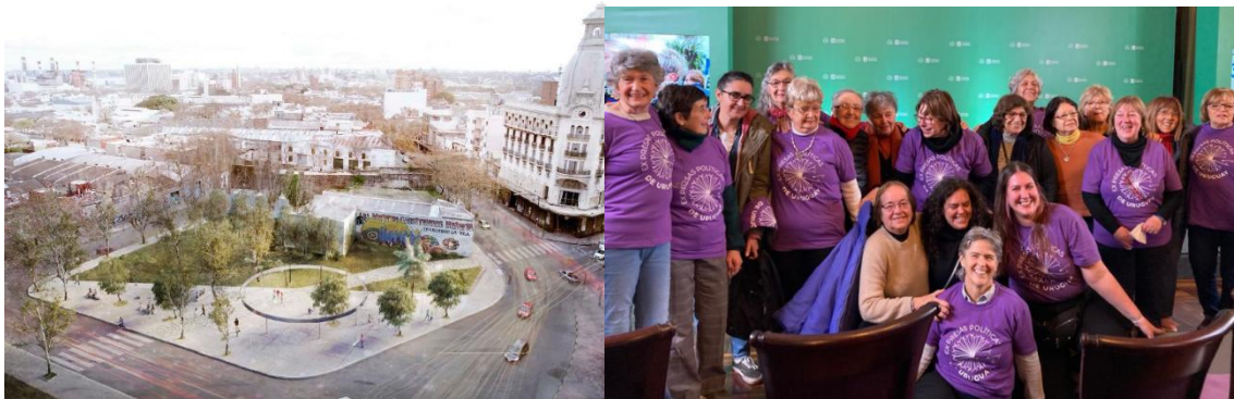
Figura 3. Concurso "Memorial a Ex-Presas Políticas (1968 - 1985)". Propuesta premiada y Fotos de lanzamiento del Concurso 2023.

Por último, vale mencionar la iniciativa "Mujeres con Historias" , orientada a imaginar nuevas formas de habitar desde una perspectiva feminista y colaborativa. Este colectivo cuenta con el acompañamiento de la SAU y el reciente apoyo de la Intendencia de Montevideo, que otorgó en comodato una finca en la Ciudad Vieja para su desarrollo a través de un futuro concurso abierto.