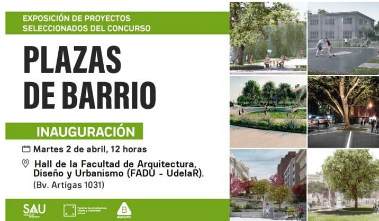
Figura 4. Concurso "Plazas de barrio". Afiches y Fotos de entrega de Fallos. 2023.

La coyuntura actual uruguaya, presenta señales de acción y abre el debate sobre la participación técnica así como consideraciones de género en los procesos proyectuales. Las iniciativas presentadas son sólo algunas de las experiencias en curso, que invitan a repensar la manera que hacemos nuestros entornos habitables, la necesidad de continuar incorporando miradas inclusivas donde los procesos proyectuales sean herramienta de transformación hacia la igualdad social.