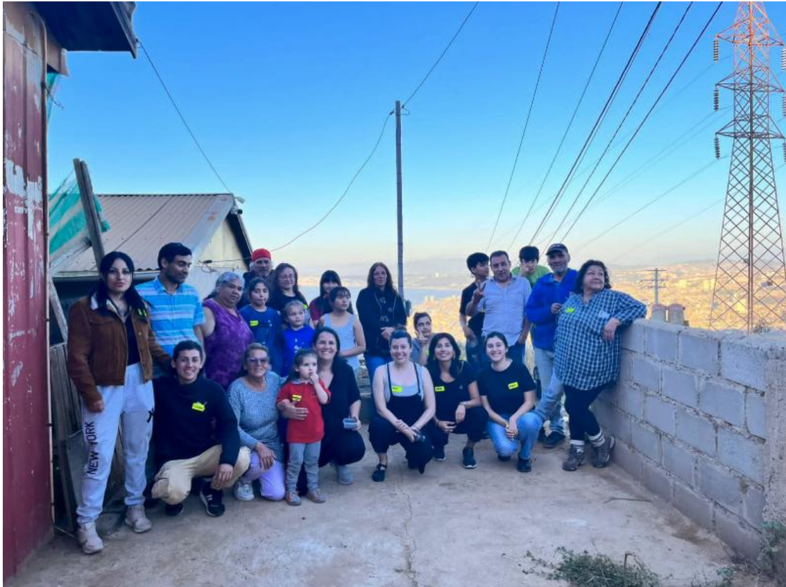
Figura 2: Jornada de Participación Ciudadana en Mesana Alto, Valparaíso.

como imprescindibles la sala multiuso, el baño con mudador, el espacio de lactancia, la cocina, el patio de encuentro comunitario, los juegos infantiles, el jardín/huerta y la bodega.