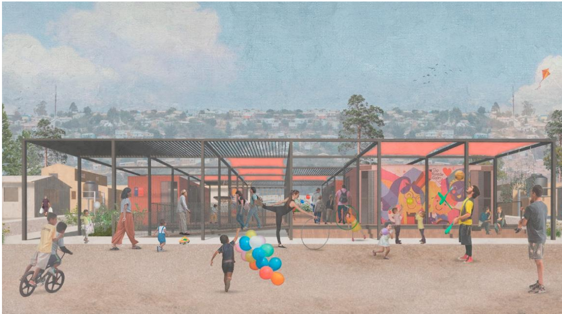
Figura 1: Imagen Objetivo prototipo Centro Comunitario de Cuidados y Protección.. Fuente: Archivo de proyecto. Elaborado por Equal Saree (2024).

La consultoría 130 , ejecutada entre octubre de 2023 y abril de 2024, tuvo como objetivo el diseño de un prototipo modular, escalable y trasladable de infraestructura comunitaria destinado a campamentos en proceso de urbanización. El CCC se concibe como un espacio multipropósito orientado al cuidado comunitario, las actividades colectivas y el fomento de la economía local, articulando tres dimensiones programáticas: espacios de cuidado, de actividades comunitarias y de economía local. Su diseño responde a un enfoque de derechos, género, reducción de riesgos de desastres y gestión comunitaria, principios establecidos en el Plan de Emergencia Habitacional 2022–2025 del MINVU.