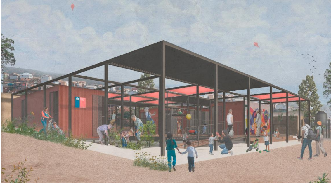
Figura 5: Imagen Objetivo prototipo Centro Comunitario de Cuidados y Protección. Fuente: Archivo de proyecto. Elaborado por Equal Saree (2024).