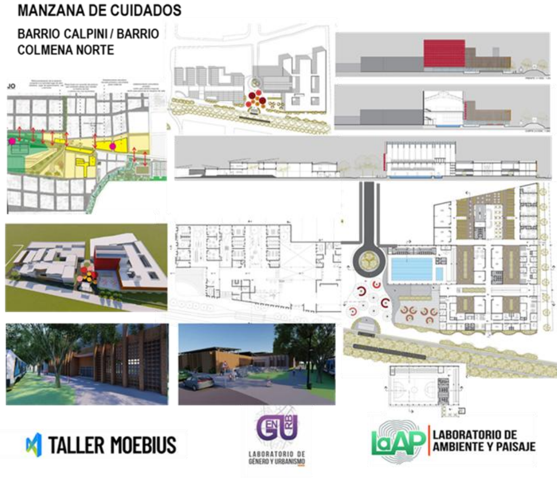
Figura 4. Sector Talleres de Tafi Viejo - Infraestructuras de Cuidado