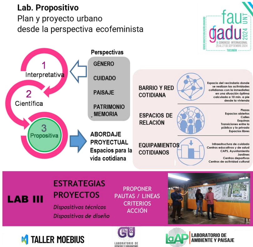
Figura 1. Propuesta de Laboratorios de articulación pedagógica

Se incorporan la nociones de infraestructuras de cuidados, así como las infraestructuras verdes y azules, buscando generar espacios urbanos más inclusivos y resilientes. Para definir estrategias y criterios de diseño se ensayaron dispositivos proyectuales como el Toolkit de Género en iniciativas urbanísticas (Sánchez de Madariaga y Novella, 2021) organizadas según cuatros grandes temas: residencia, espacio público, equipamientos y movilidad (Figs. 2).