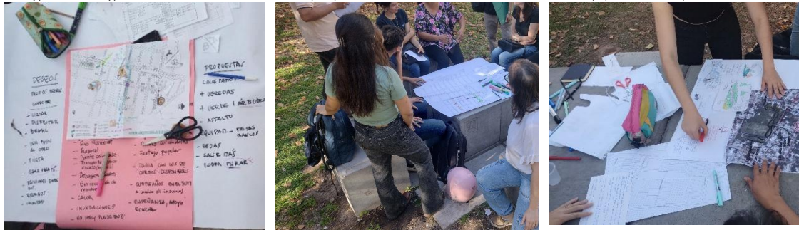
Figura 3 a, b y c. Producciones Laboratorio propuestas en distintas escalas.

Se reflexionó a partir de interpelar las aproximaciones desde un abordaje feminista y la relación entre la intervención proyectual del espacio público desde las interacciones entre género, arquitectura, paisaje y cuidados. Se trata de explorar conceptos y operatorias –programáticas, formales, espaciales, materiales– que permita a las personas cuidadoras y personas dependientes de cuidado una representación y un acceso al espacio público en equidad de condiciones. Cada equipo que articuló aproximaciones, y aportes disciplinares y saberes locales, expresó sus reflexiones y producción en afiches y mapeos colectivos.