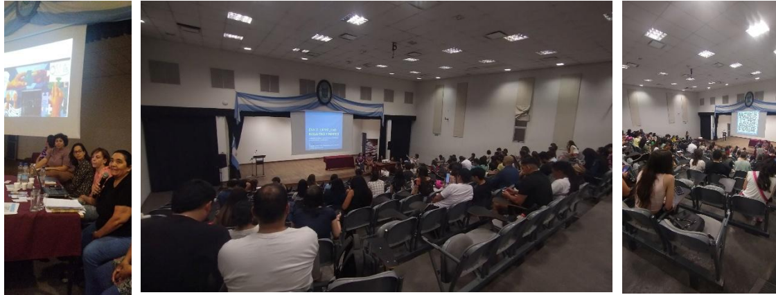
Figura 1 a, b y c. Laboratorio Experiencias.

Aprovechando la sinergia entre el ámbito académico y las demandas sociales que emergen del contexto actual.