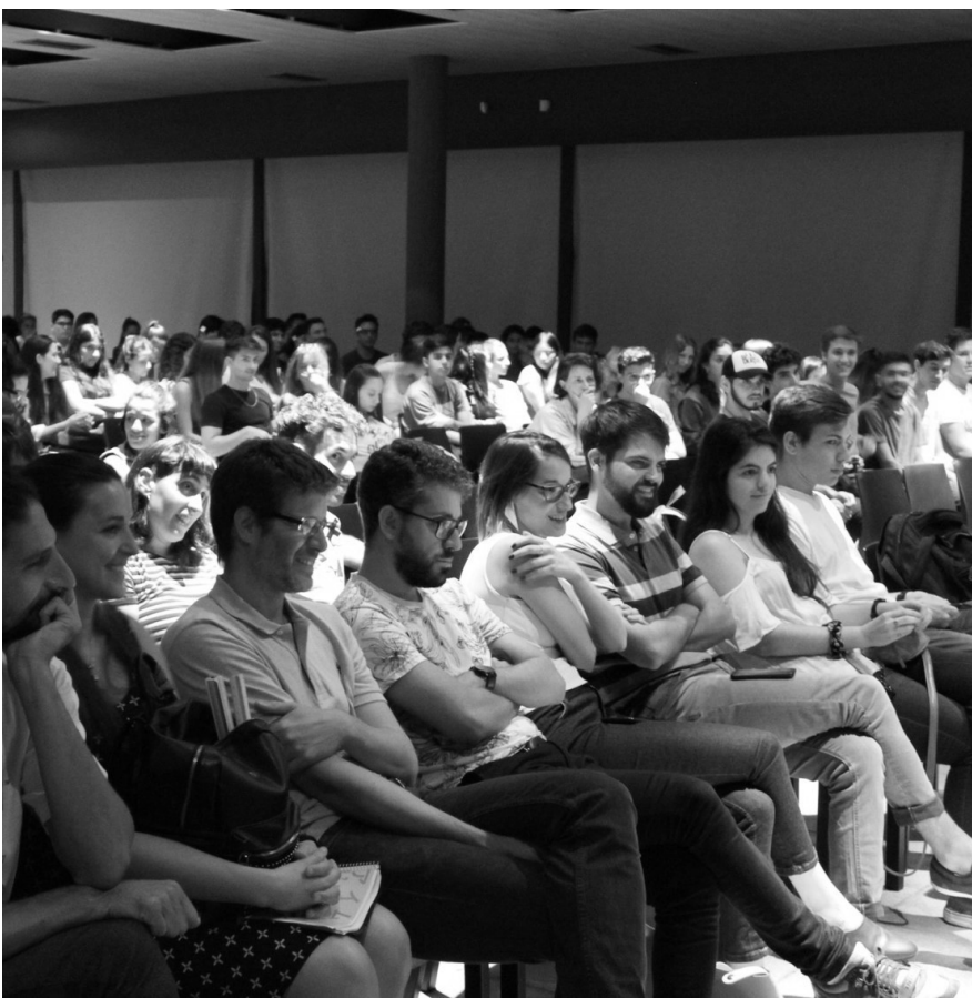
Imagen 1. Derecha: 14 estudiantes del CAU exponiendo su evaluación, delante de sus docentes y compañeros (Izquierda).

El epígrafe transcribe las palabras de Agustín, un estudiante ingresante a la carrera de Arquitectura de la Facultad de Arquitectura, Planeamiento y Diseño (FAPyD) de la Universidad Nacional de Rosario (UNR) en el acto de cierre del Curso de Aprestamiento Universitario 2019 para los alumnos de tal condición (Figura 1).