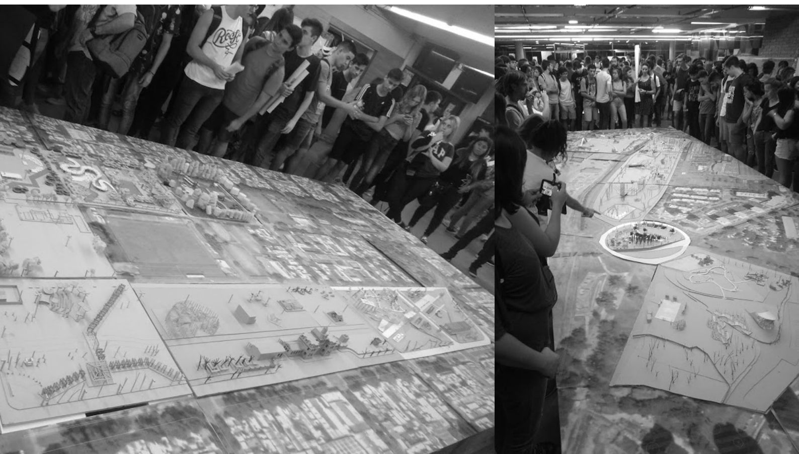
Imagen 4. Acto de cierre. Exposición de maquetas del TP2 Proponer arquitectura en el hall de la facultad.