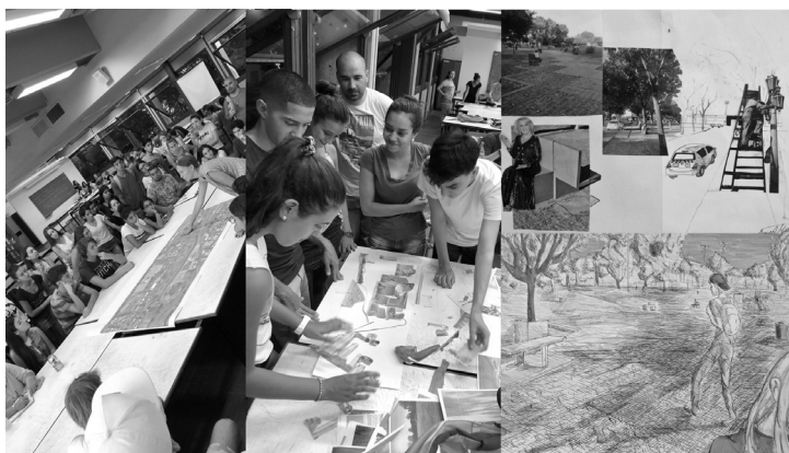
Imagen 3. TP1: Observar arquitectura. Trabajos en taller y muestra.