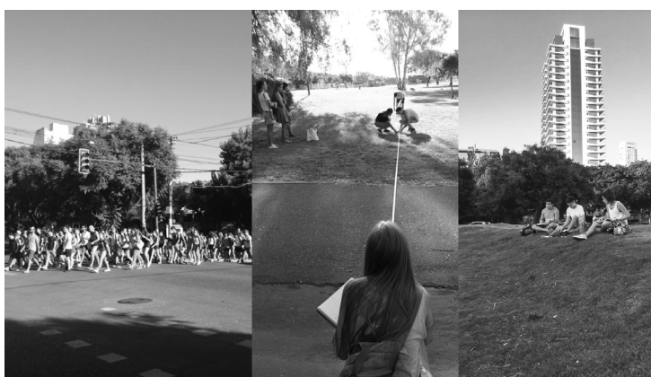
Imagen 2. TP1: Observar arquitectura. Visita a los Parques Yrigoyen y Scalabrini Ortiz.