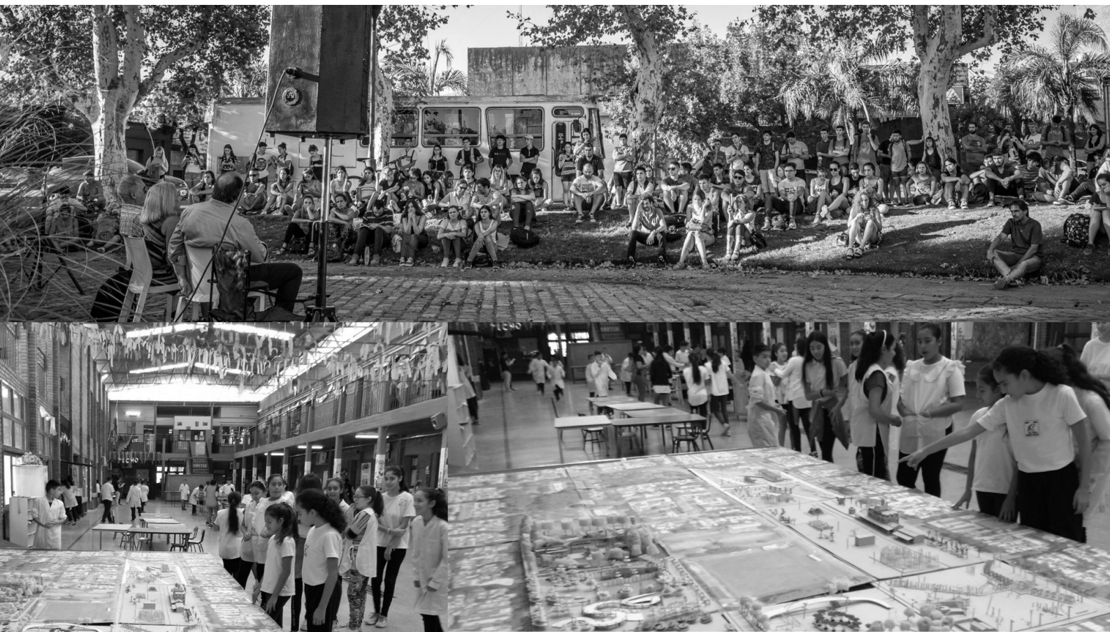
Imagen 7. Arriba: Mesa redonda del CAU en Parque Yrigoyen, en el marco del Paro nacional de docentes universitarios. Abajo: Exposición maqueta CAU en la Escuela Pública N° 147 “Provincia de Entre Ríos”, Rosario, Santa Fe.