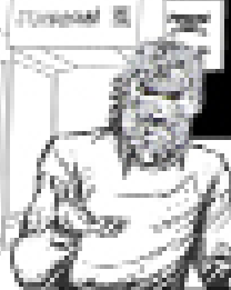
UN DARK DECORACIONAL EN ESTA CALLE