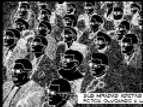
LOS HABITANTES DE CRISTALIZAN A ACCO DE FIGURAS ARQUITECTONICAS SE HUBIERA PARTE DE UN DECORADO HATTE