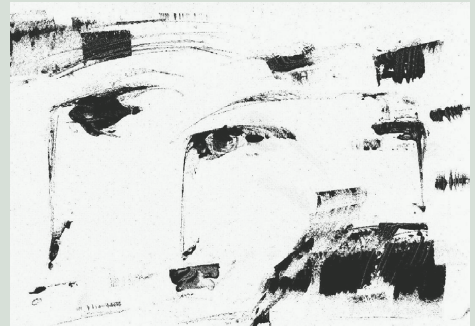
"re-pro-grafias" de la serie trazo-grafias, secuencia de trazos que invita a los que la ven a que participen poniéndole nombre a cada gesto grafiado. Fue expuesta en San José del Guaviare, en el año 2017, en el marco del cierre de la cohorte de estudiantes de la maestría de comunicación y medios del IECO. (Instituto de estudios en comunicación- UN)

Un objetivo inmediato, Trans-itar por los territorios es una senda que no se acaba, ir al camino del reconocimiento de la certeza de que, para seguir cuidando la vida, se pasa por entender que hay que dar la vida, ser sal y fermento, darse en su justa medida para saber diluirse y hacer que todos brillen desde su propia naturaleza. Aún falta mucho, pero el horizonte tiene aroma de inspiración, antes de que nos llegue la expiración.