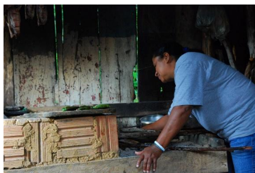
Imagen 6. Preparación de alimentos tradicionales en la estufa de leña.

Todavía, hay una pesca complementaria que les permite alimentarse de algunos pescados del estuario. Un elemento que no puede dejar de mencionarse es la harina de yuca artesanal, siempre presente en la mesa o en las preparaciones. Aunque ya no se