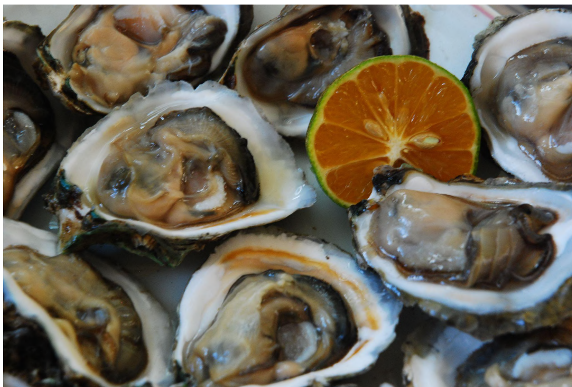
Imagen 5. Ostras crudas, que comenzaron a venderse a los turistas en la propia comunidad.

El panorama alimentario de Mandira, en su esencia, se asemeja al visto en Carijo. Las comidas típicas están compuestas por arroz, frijoles, ensalada, una proteína animal y una guarnición vegetal o farofa. Sin embargo, dado el contexto rural, hay más productos provenientes de los propios patios o fincas de las comunidades cercanas, como yucas, calabazas, condimentos, algunas hortalizas, palmito pupuña y algunas frutas. La ostra, que representa el mayor aporte económico de la pesca, está presente en las comidas de forma ocasional. El tipo de turista que va a la Mandira ayudó a fortalecer la ostra como ícono local, renovando también el aprecio de la propia comunidad por el