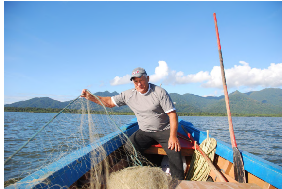
Imagen 2. Pescador del barrio Carijo con la red de enmalle.

y pavimentación en las calles. Hay algunos ríos y manglares que cruzan el barrio, lo que incluye un pequeño puerto de barcos y ranchos de pesca artesanal. Su historia está relacionada tanto con la pesca en el municipio como con el proceso de desarrollo del centro urbano. Las primeras familias que se instalaron allí provenían de la zona rural del municipio, ubicada en la parte continental del mismo. Alrededor de 1930, la agricultura, que hasta entonces era una actividad importante en la región, comenzó a declinar por diversos motivos. Muchas familias construyeron ranchos de pesca en Carijo, que utilizaban durante algunos días durante las temporadas de pesca, principalmente de la lisa ( Mugil lisa ). La pesca de la lisa llegó a tener una mayor importancia en la vida de las familias que la agricultura, lo que llevó a muchas de ellas a mudarse a Carijo. Muchas mantuvieron sus sitios en el continente como una fuente complementaria de producción de alimentos, pero la mayoría terminó abandonándolos debido a dificultades con la regularización de la tierra, el desplazamiento y las restricciones ambientales.