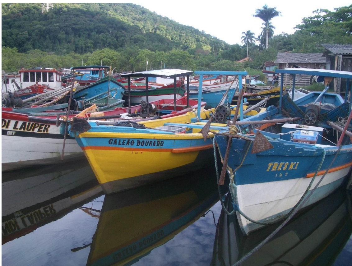
Imagen 3. Puertito de Carijo, lugar de embarque y desembarque.

Cabe destacar que la pesca semi-industrial de gambas tiene gran relevancia en Cananeia, y muchos pescadores del barrio, así como sus familias, están empleados en esta cadena productiva. La gamba también está muy presente en las comidas, y es común que se realicen pequeñas donaciones a familias cercanas. En menor presencia, también encontramos cangrejos, ostras y mariscos, en un estrato que se mantiene en las actividades pesqueras artesanales de pequeña escala. A pesar de un contexto local caracterizado y movido por la pesca, la rutina alimentaria tiene mayor presencia de alimentos de fuera, predominantemente de bajo costo,