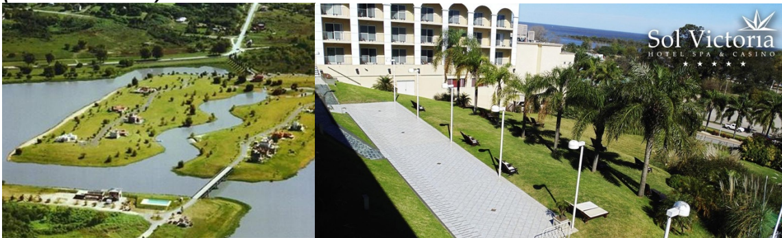
Figura 5. Country Náutico el Solar de Victoria y Hotel-Casino Sol Victoria

En el trabajo titulado, ¿Cuántas Victorias hay? (Ferrero, 2013) se cita una página Web que promocionaba el country náutico, página actualmente inexistente, en la cual se ofrecía: