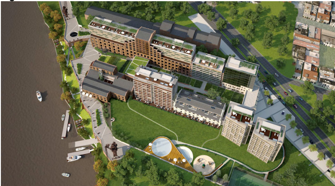
Figura 4. Puerto Norte

En la foto puede apreciarse que, la franja/ tira de espacio público remanente es solamente el piso de cemento ya que, el borde verde ligado al río son terrenos privados de las torres.