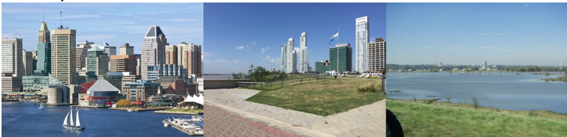
Figura 3. Izq.: Baltimore, EEUU; Centro: Rosario, Puerto Norte; Der.: Victoria, B° Náutico Privado

valores de los edificios del área, de los alquileres, llevando a un recambio poblacional y atrayendo a poblaciones de mayor poder adquisitivo.