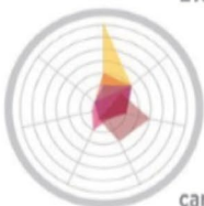
características del proyecto