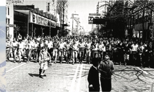
Arriba: manifestación colectiva "cordobazo" Argentina

La fuerza de los movimientos sociales junto con estados ausentes (en territorios alejados de la ciudad) o estados que acompañen el proceso (en territorios cercanos a la ciudad) moldean los cambios hacia un ejercicio del derecho a la ciudad.