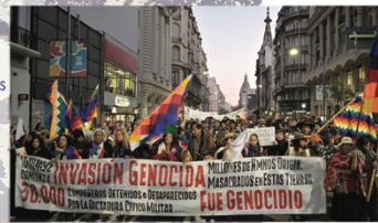
Izquierda: manifestación contemporánea de pueblos originarios.