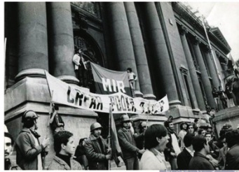
Arriba: manifestación de los años 70 en Santiago de Chile - MIR

Sede de Investigación y/o Pertenencia Institucional: Universidad de Buenos Aires, Facultad de Arquitectura, Diseño y Urbanismo, Programa Urbanismo y Ciudad / Instituto Superior de Urbanismo, Territorio y Ambiente + Instituto de Espacialidad Humana + Gestión Urbana Contemporánea cátedra Szajnberg / Unidad de Investigación: Planeamiento Urbano y Regional.