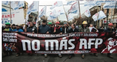
Arriba: manifestación contemporánea en Santiago de Chile contra el sistema previsional impuesto en dictadura.