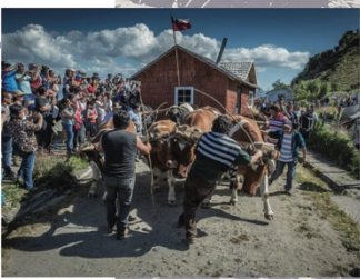
Derecha: Minga tradicional chilota de trabajo comunitario en el sur de Chile.