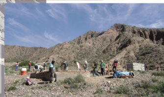
Abajo: Minga o trabajo comunitario en Ticara.

Entendemos el derecho a la ciudad desde los estudios de Lefevre y como lo abordamos a través de los años en la construcción de la historia de las ciudades y los derechos que se fueron ganando como ciudadanos, el enfoque más contemporáneo del derecho a la ciudad incluye el derecho a poder transformar las ciudades, un enfoque un poco difuso en el imaginario colectivo, ¿pero es así realmente?