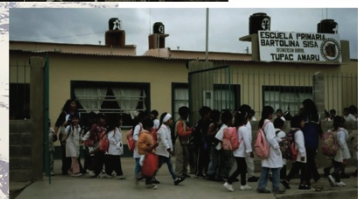
Abajo: Niños de la escuela primaria de la organización barrial Tupac Amaru