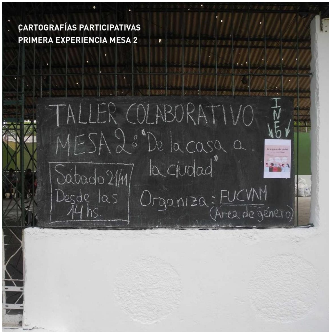
Figura 4: Fotografía taller colaborativo - Mesa 2, año 2020.

Elaboración: equipo de trabajo ITU/EFI Coop.