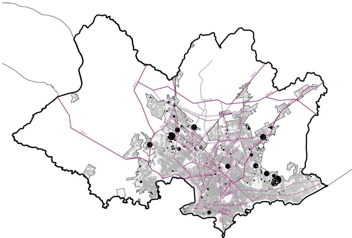
Figura 2: Mapa de cooperativas por ayuda mutua afiliadas a FUCVAM, agrupadas por escala en Montevideo.

Elaboración: equipo de trabajo ITU/EFI Coop.