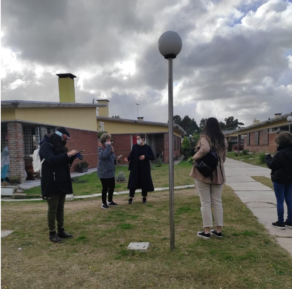
Figura 7: Encuentro entre estudiantes, docentes y cooperativistas, COVIVET, Mayo 2021.

Elaboración: equipo de trabajo ITU/EFI Coop.