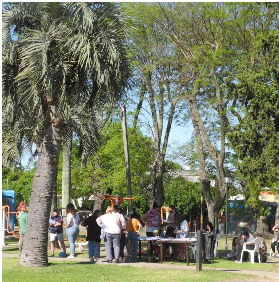
Figura 5: Jornada de mapeos colaborativos - Mesa 2, año 2020.