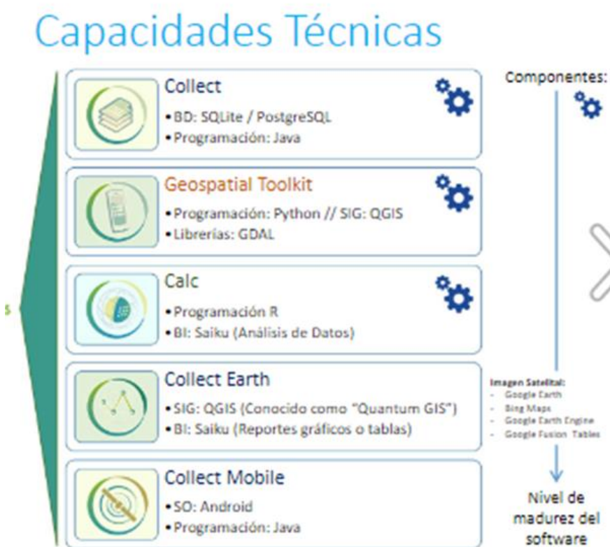
Figura 2: PROTOCOLO PARA EL USO DE LA PLATAFORMA OPEN FORIS (2016)

Las herramientas de Open Foris han sido desarrolladas para asistir a las necesidades, desde la evaluación de requisitos, el diseño, la planificación, la recolección de datos hasta el procesamiento, estimación, análisis y difusión de la información. Para la implementación de cada etapa del inventario a través de Open Foris se han desarrollado las siguientes herramientas: Diseño de formularios e ingreso de datos: Se han desarrollado las herramientas de Open Foris Collect Designer, Collect y Collect Mobile para el diseño de la base de datos e ingreso y almacenamiento de datos.(figura 2) PROTOCOLO PARA EL USO DE LA PLATAFORMA OPEN FORIS (2016)