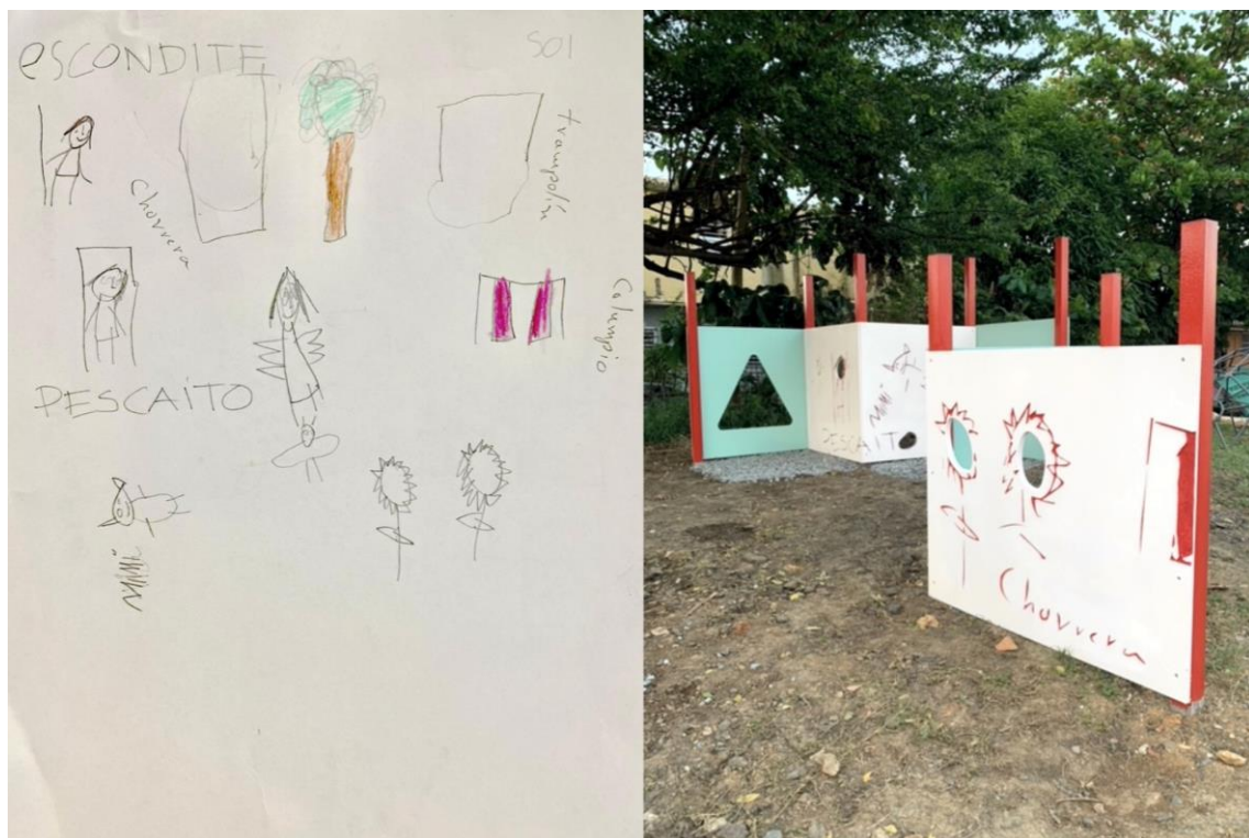
taller Creando Sin Encargos (tCSE)