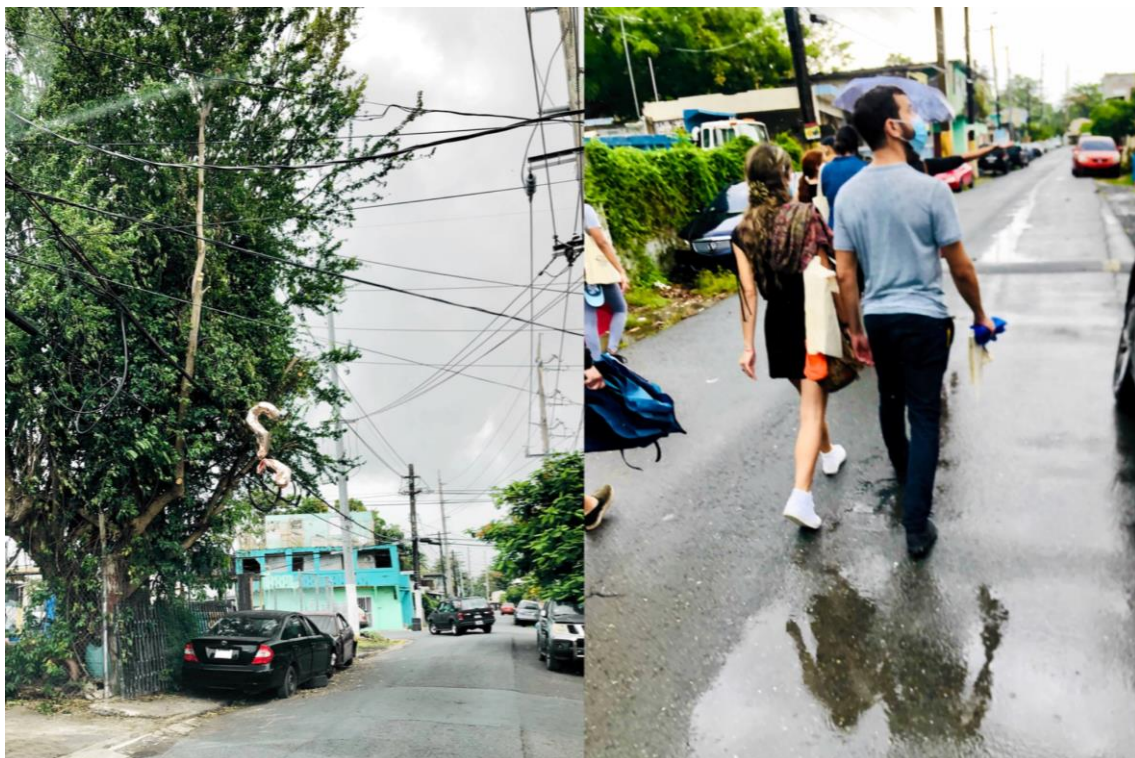
taller Creando Sin Encargos (tCSE)