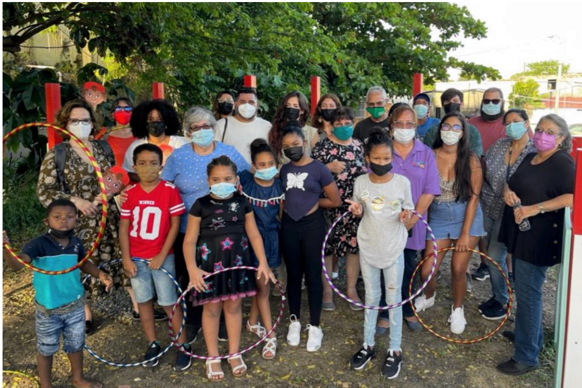
Museo de Arte Contemporáneo de Puerto Rico (MAC)