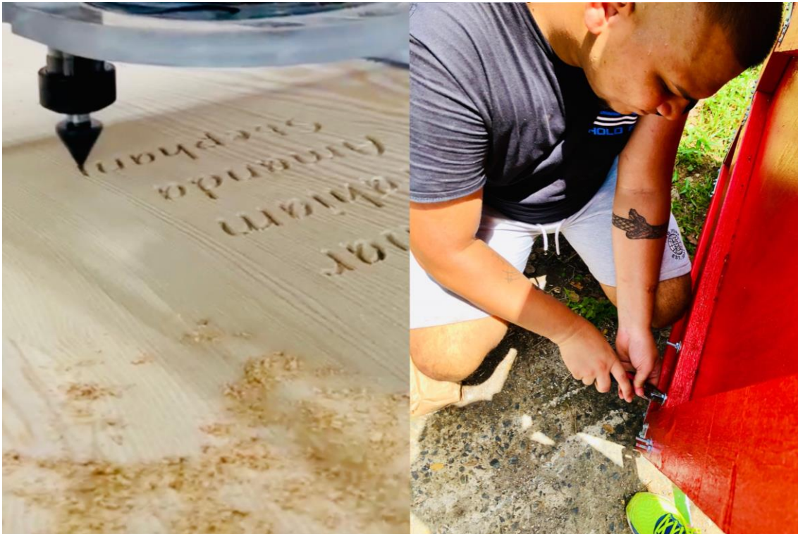
taller Creando Sin Encargos (tCSE)

“Los conocimientos situados son sobre comunidades, no sobre individuos aislados. La única forma de encontrar una visión más amplia es estar en algún lugar en particular.” (Haraway 1988, p.590)