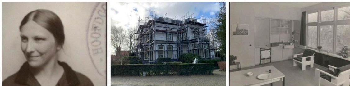
Figura 4: Geertruida Antonia Schröder-Schräder, Departamentos para mujeres trabajadoras EKAWO, 1938. Estado actual y departamento diseñado por Schröder-Schräder.