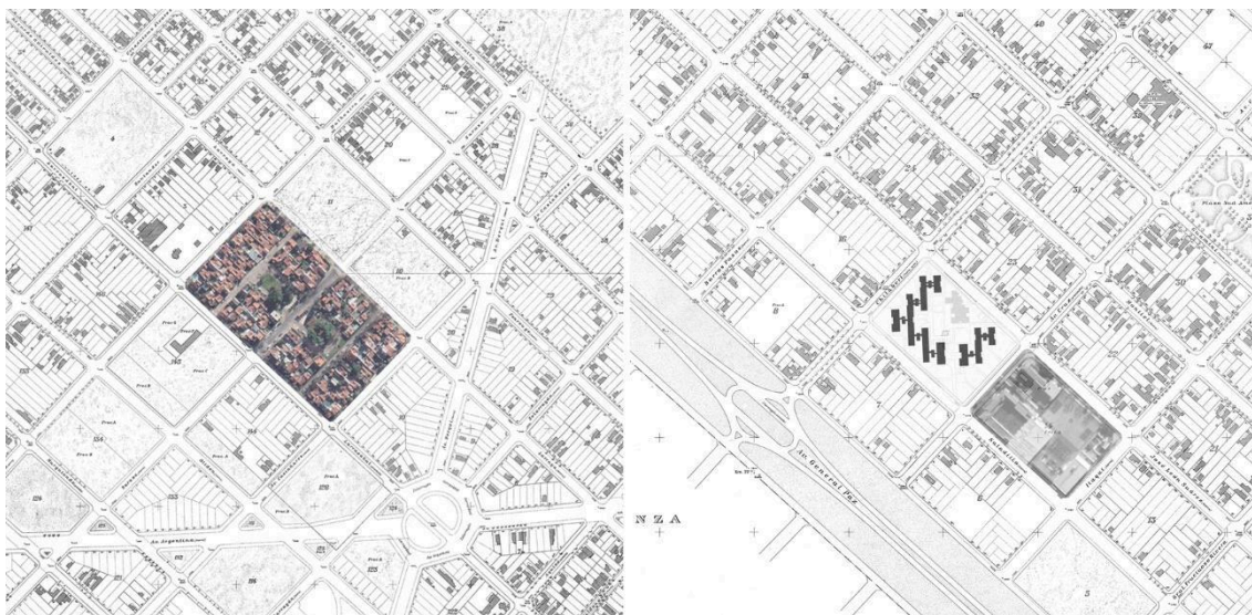
Figura 3. Barrio Modelo Villa Lugano (1943) y Conjunto Villa Lugano (1975). Montaje de fotografía área actual sobre catastro de la Ciudad de Buenos Aires (Goyeneche. 1940)

En ese sentido es imprescindible comparar los casos a estudiar analizando sus condiciones de localización con fuentes que describan el área de intervención del proyecto, el grado de consolidación del tejido cercano, la forma y tamaño del parcelamiento, la normativa y proyectos o planes en los que se inscribe el caso, y las condiciones específicas del lote donde se implanta, su condición de propiedad y normativa particular para comprender en qué medida estas nuevas tipologías se relacionan con la ciudad existente y con la ciudad proyectada (Figura 3 y 4).