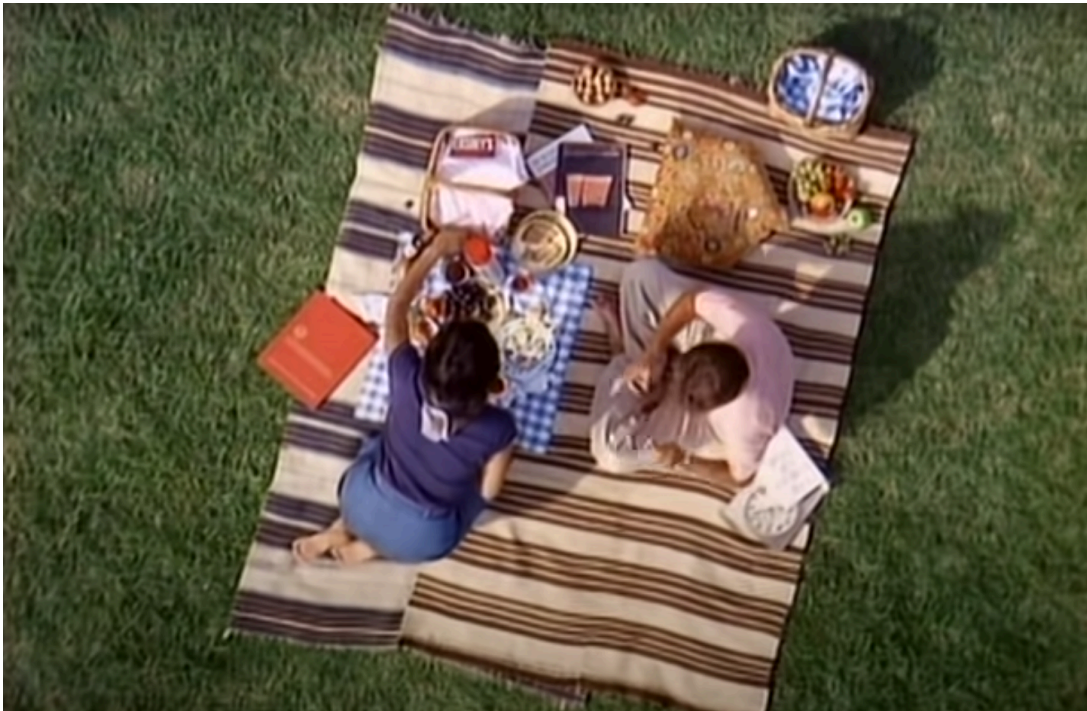
Figura 3: Power of ten. 1977