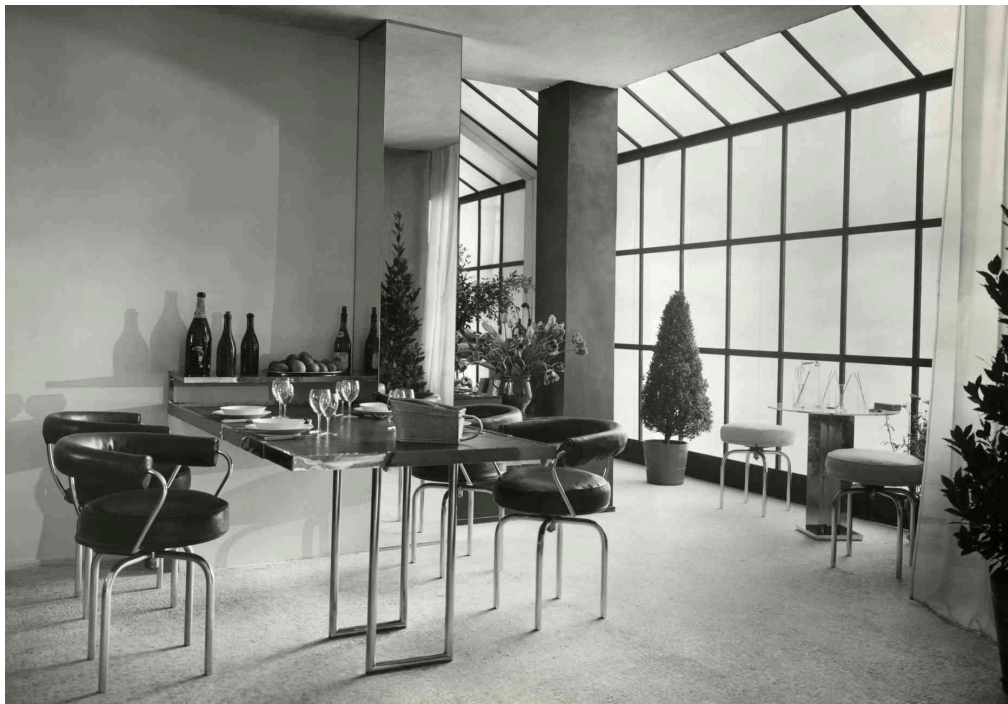
Figura 2: Apartamento Saint-Sulpice.

Mesa Adosada: es una mesa que se fija a la pared en uno de sus lados, dejando los otros lados libres. Su característica principal es que se puede plegar por lo que es muy útil en espacios reducidos para aprovechar al máximo la dimensiones y proporcionar una superficie de apoyo adicional. Los monoambientes o las cocinas de departamentos pueden contar con una de estas mesas. También Las casas rodantes o los barcos que cuentan con medidas muy acotadas cuentan con uno de estos planos de apoyo. (Figura 2)