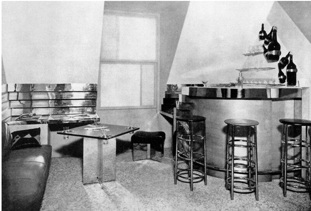
Figura 1: Bar Sous Le Toit , año 1927. Salon de Otoño de Paris. PARIS ACHP.