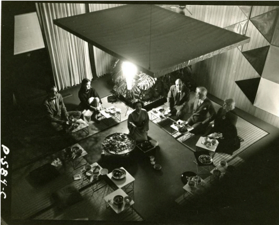
Figura 3: Disposición espacial doméstica como referente

Ceremonia del Té en la Casa de los Eames, 1951, en la que aparecen Isamu Noguchi, Yoshiko Yamaguchi, Charles and Ray Eames, and Charlie Chaplin.