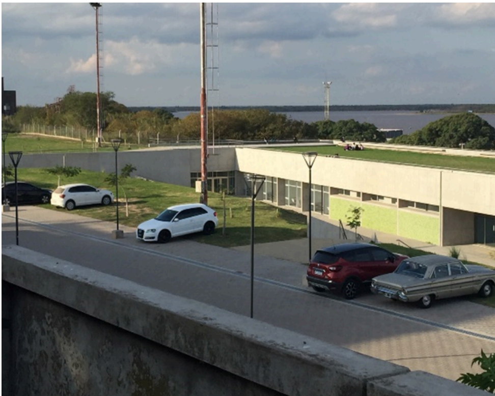
Figura 9: Autor Cristina Gomez