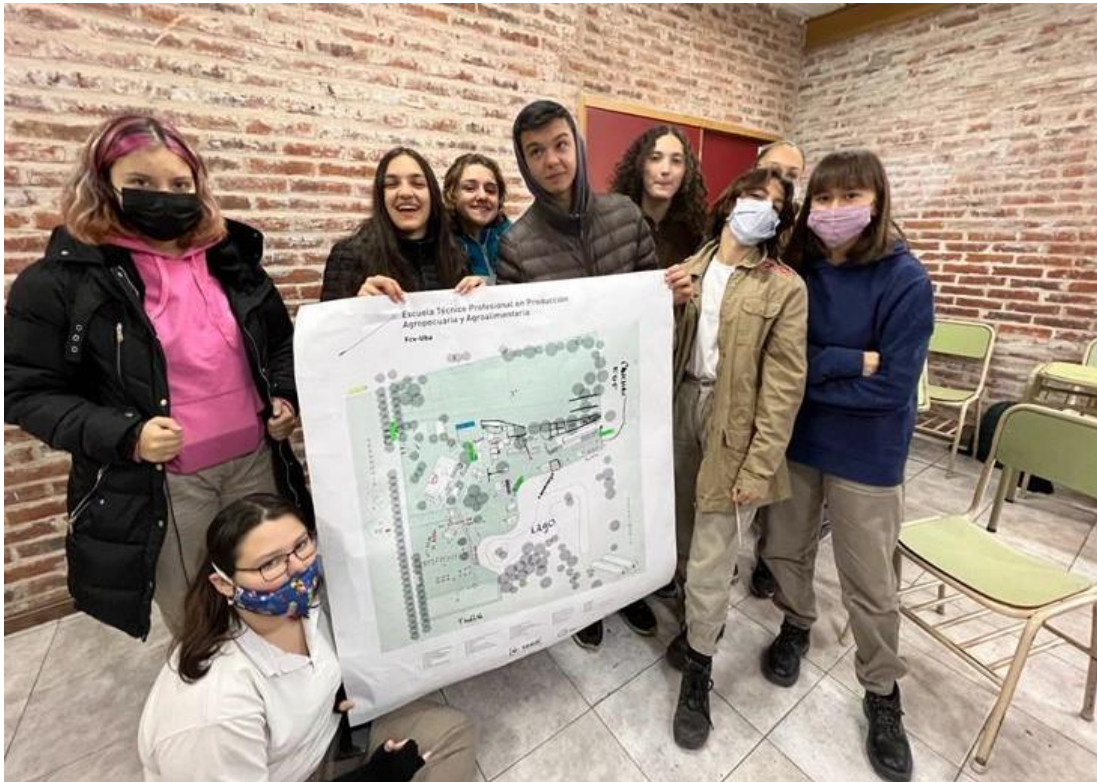
Equipo Semilla urbana + estudiantes 2do año B y C Escuela Agropecuaria