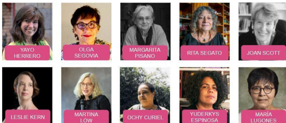
Figura 2: Algunas autoras incorporadas a la investigación

Elaboración propia en base a recopilación fotográfica