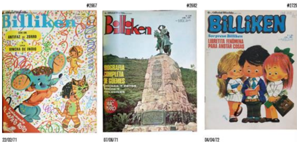
Figura 2. Tapas de la revista Billiken analizadas para esta prueba.