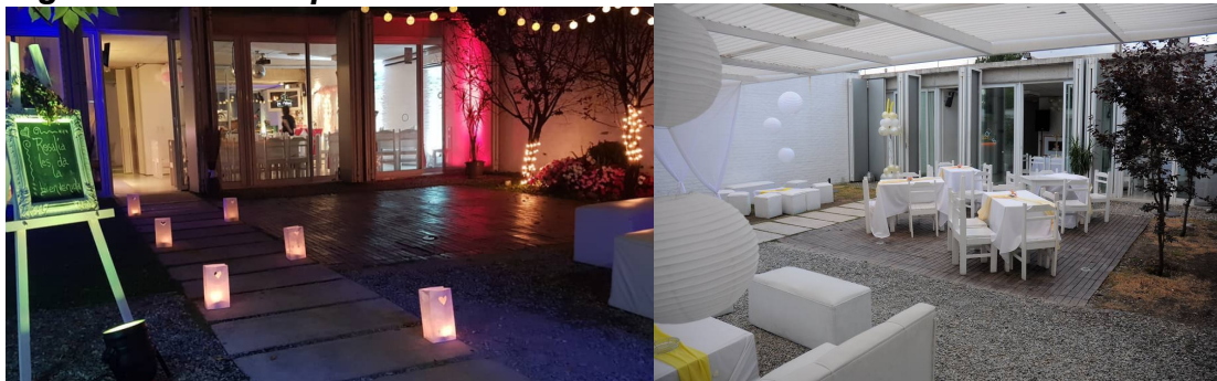
Figura 3: Casa Arquitectura Rifa 2009

que son las biografías y las autobiografías ubicadas en el paradigma positivista -con su lucha por “volverse científicas”- al polo opuesto que representa la propuesta autoetnográfica, con una mezcla indisoluble entre las dimensiones tradicionalmente llamadas objetivas y subjetivas” (Blanco, 2012)