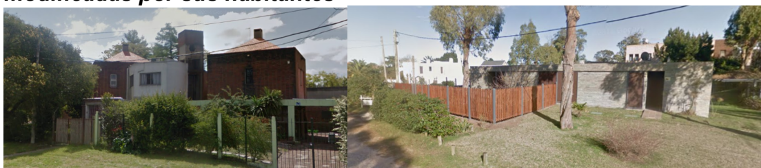
Figura 2: Casa de Arquitectura Rifa 1984 (izq.) y 2000 (der.), parcialmente modificadas por sus habitantes

Como objetivos particulares se plantea: a. inventariar el universo en relación a sus proyectos originales y su situación presente, factible de convertirse en repositorio actualizable; b. evaluar posibles figuras de valoración y/o protección patrimonial; c. ponderar las variaciones entre proyecto original y situación actual y su categorización; y finalmente, d. generar un atlas de situación que habilite un mapeo de situaciones y un sistema de referencias para aventurarse en la interpretación de la articulación proyecto/habitar.