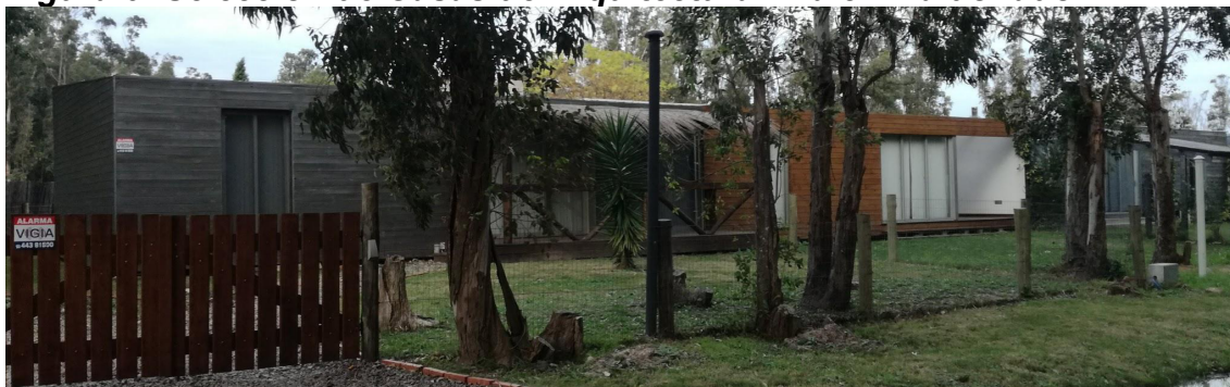
Figura 6: Selección de Casas de Arquitectura Rifa en Maldonado.

Por último, los habitantes han sido los grandes ausentes de las reflexiones sobre estos proyectos. Frecuentemente fotografiadas al culminar la obra, las casas se adjudican y no existe un seguimiento específico de las formas de habitar que propician y de las adaptaciones sufridas.