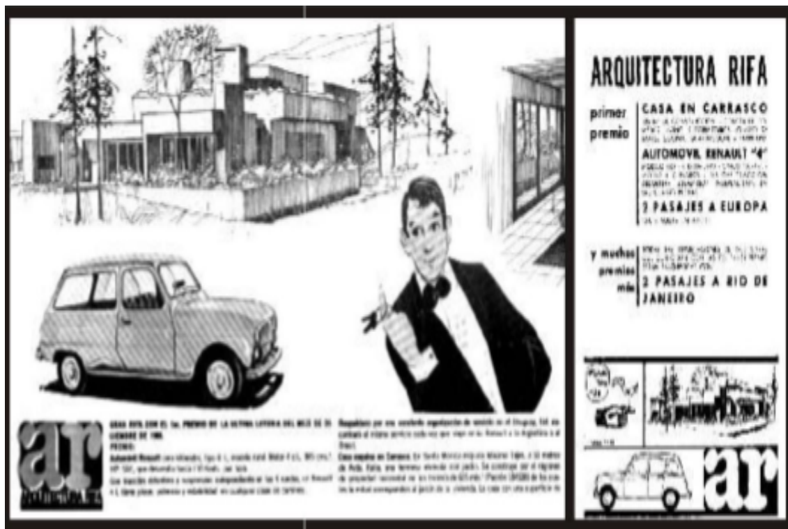
Figura 1: Gráficos publicitarios Arquitectura Rifa, promocionando la Casa. Generación 62.