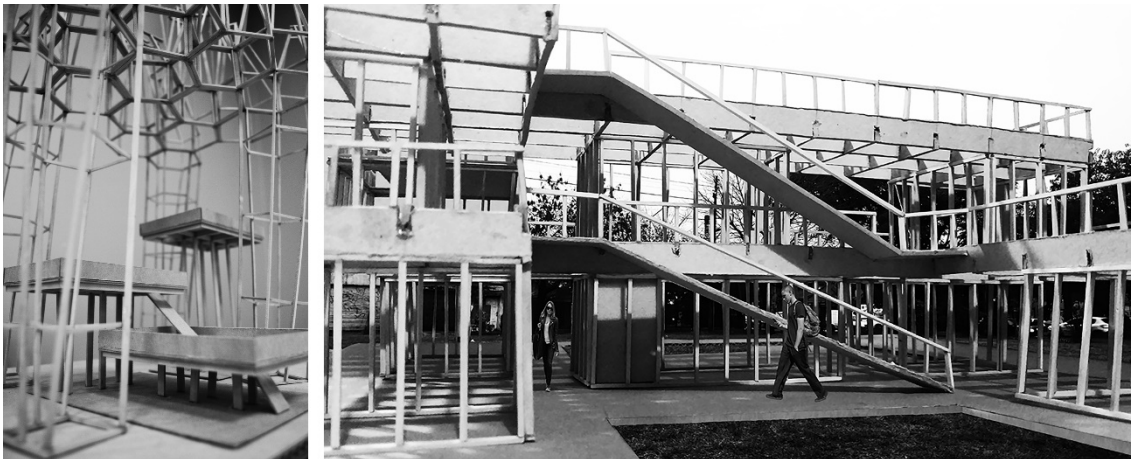
Imagen 2: Trabajos de alumnos 2017