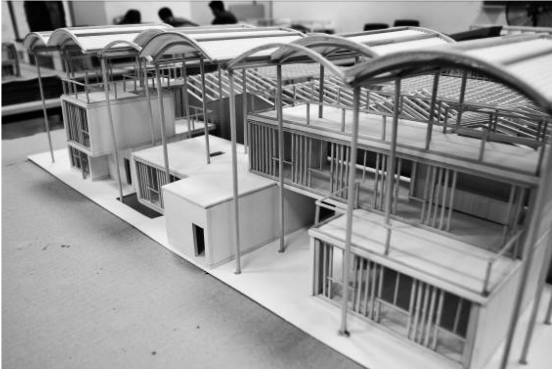
Imagen 6: Trabajos de alumnos 2016