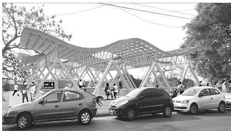
Imagen 3: Trabajos de alumnos 2017