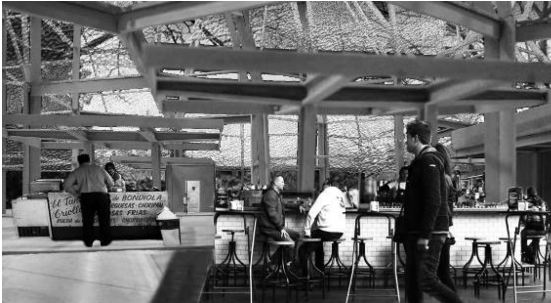
Imagen 4: Trabajos de alumnos 2017