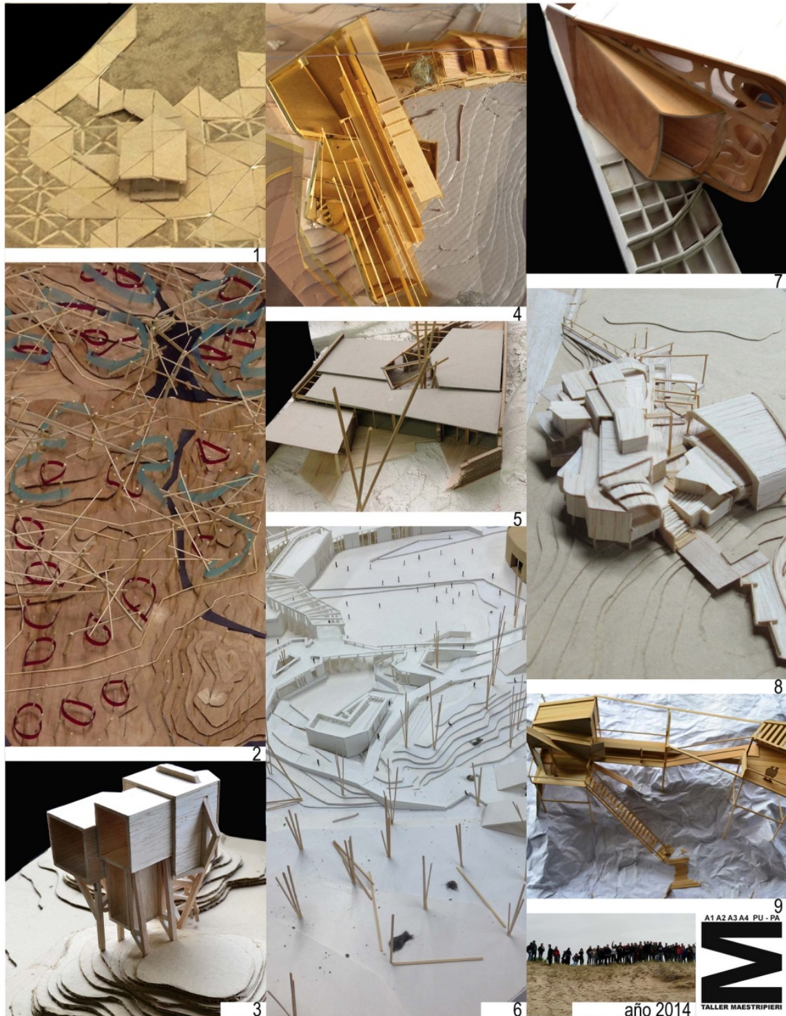
Imagen 1. Villa Gesell 2014