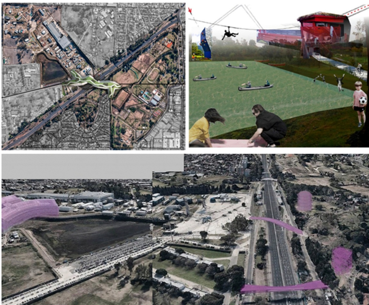
Imagen 3. Saavedra (2018). Distintas propuestas primera parte ejercicio PUM.

A través del estudio de representaciones pensadas en otros momentos históricos, se pudo encontrar una idea de Saavedra imaginada desde su condición geográfica natural. Así, se encontraron denominaciones del lugar como «Pueblo del Lago» en un artículo publicado en un diario de 1873 (El Nacional, 1873) o también como «Paseo Del Lago» en la propuesta de la Comisión de Estética Edilicia de 1925. Sin embargo, esta imagen de Saavedra vinculada con el arroyo cambiaría drásticamente luego del entubamiento realizado en la década de 1930. A mediados de la década de 1940, con la construcción del Barrio Perón, se pudo ver materializado en este sitio el sueño de “la casa propia” con un imaginario de casa chalet tipo “californiano” y también, quizás vinculado con la necesidad de brindar un equipamiento público para los nuevos habitantes, una propuesta de un zoológico. Por su parte, en la década del '70, junto con la aprobación de un nuevo Código de Planificación urbana que promovería un “Plan de autopistas” comienzan a aparecer propuestas para parques, como el proyecto de Burle Marx o también una voluntad de construir “ciudad” a través de