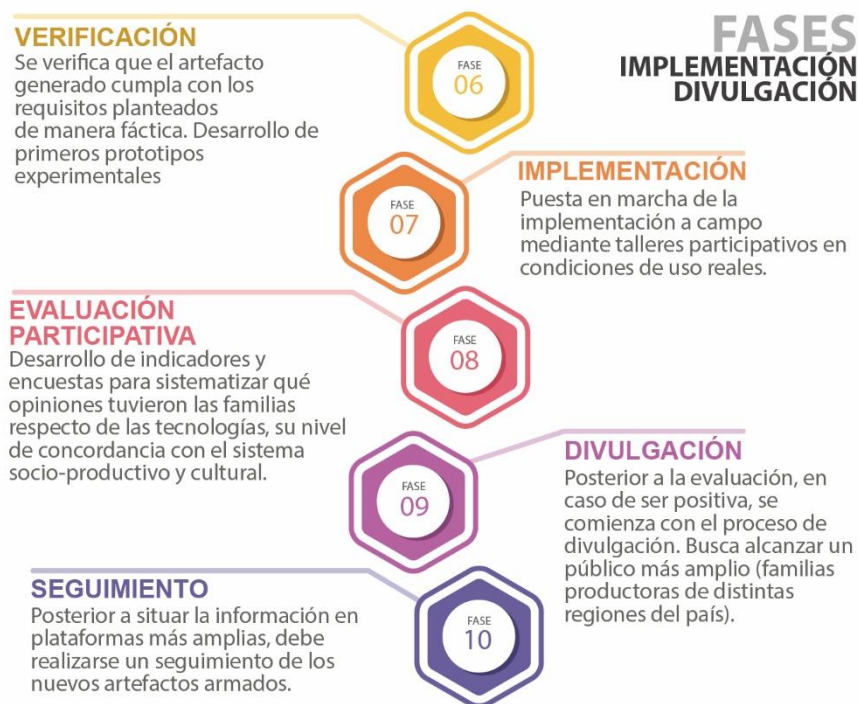
Figura 4. Fases correspondientes a la implementación y la divulgación.