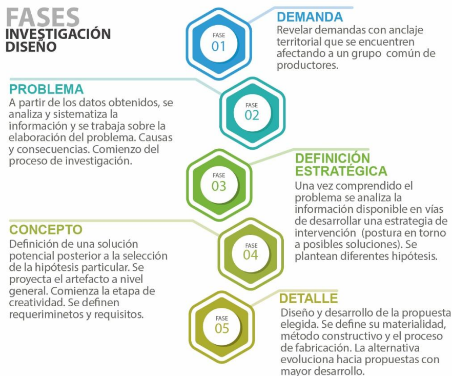
Figura 3. Fases correspondientes a la investigación y diseño.

A continuación, se describen las etapas correspondientes a las fases de un proceso de diseño industrial abierto. Para ordenarlas, se dividen en dos grandes etapas, investigación y diseño por un lado (Figura 2), e implementación y divulgación (Figura 3) por el otro.