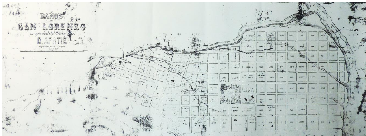
Figura 2: Copia del plano de los “Baños de San Lorenzo” trazado por Vicente Arquati en 1889.

El proyecto consiste en un trazado en cuadrícula, manzanas de 80m x 80m, en los terrenos bajos y con los perfiles más irregulares en la medida que las cotas de nivel aumentaban, atendiendo el curso de las aguas y la presencia de las propiedades ya adquiridas. Destina cuatro manzanas para la plaza en el centro del conjunto, sobre el camino principal hacia la Quebrada. Una tendencia que por aquellos años era común en las nuevas urbanizaciones, tal como el caso de plaza San Martín de la ciudad de Esperanza y de Reconquista ambas en la Provincia de Santa Fe; de Resistencia, Chaco; de Formosa y otras ciudades del interior del país.