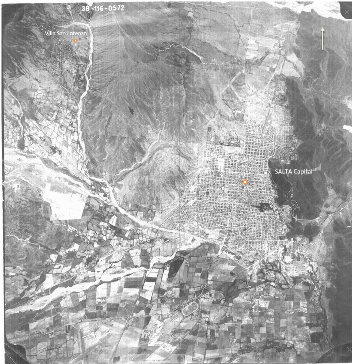
Figura 1: Foto aérea de la ciudad de Salta donde podemos apreciar el entorno natural y hacia el ángulo superior izquierdo la Villa San Lorenzo. No se conoce la data precisa de la toma fotográfica, según estimaciones del equipo pertenece a la década del 60.