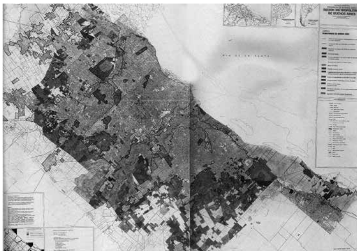
Figura 2: Plano de usos del territorio de borde de Buenos Aires.