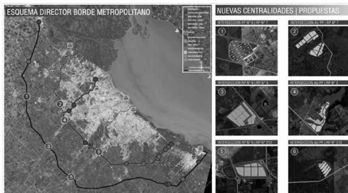
Figura 3: Propuesta.