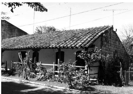
Figura 5: Vivienda en Caapucú, defendida por un muro "cáscara" exterior.