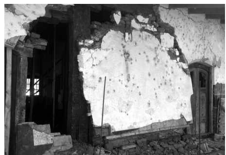
Figura 6: Uno de los muros desplomados por efecto del reblandecimiento de las hiladas inferiores.