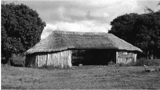
Figura 2: Vivienda rural tipo culata jovai en el Guairá (1982), donde aún se aprecia parte de la tierra del estaqueo.