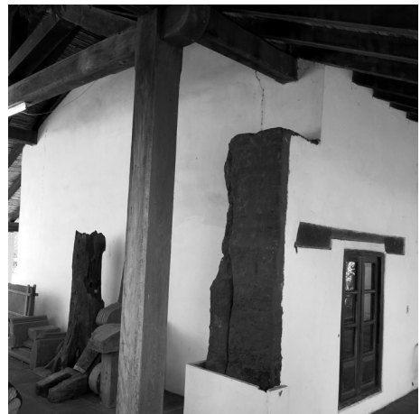
Figura 4: Muro de tipo "tapia a la vista" en San Ignacio Guasú.