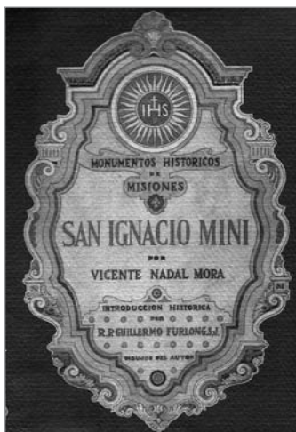
Figura 5. Portada de Monumentos históricos de Misiones: San Ignacio Mini (Nadal Mora, 1955). Dibujado a mano por Nadal Mora.