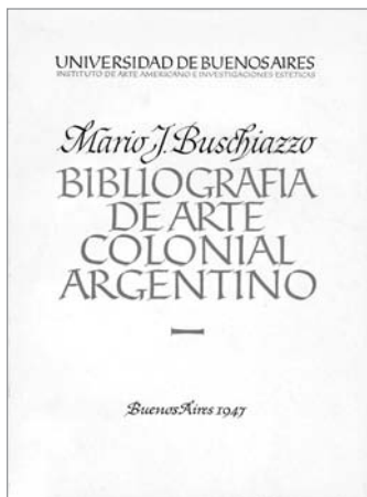
Figura 2. La portada de Bibliografía de arte colonial argentino (Buschiazzo, 1947). Dibujo de Nadal Mora.