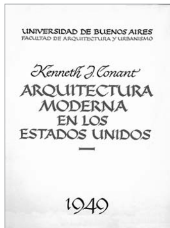
Figura 3. La portada de Arquitectura Moderna en los Estados Unidos (Conant, 1949). Dibujo de Nadal Mora.