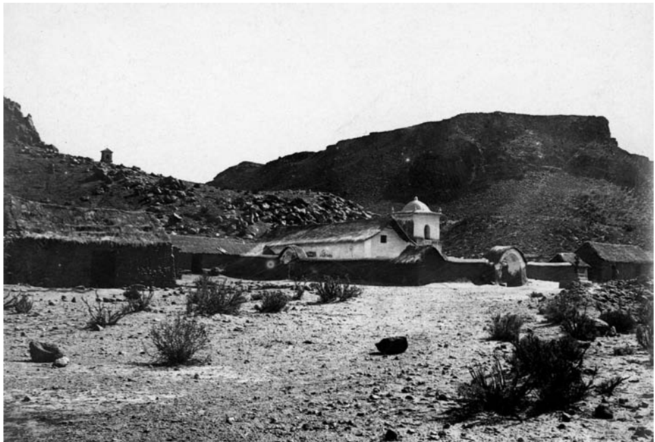
Figura 3. Fotografía de la capilla de Susques en 1903 tomada por Eric Boman (1908). Atrás del templo se distingue uno de los calvarios. Fuente: Archivo fotográfico y documental del Museo Etnográfico Juan B. Ambrosetti, Facultad de Filosofía y Letras, Universidad de Buenos Aires.