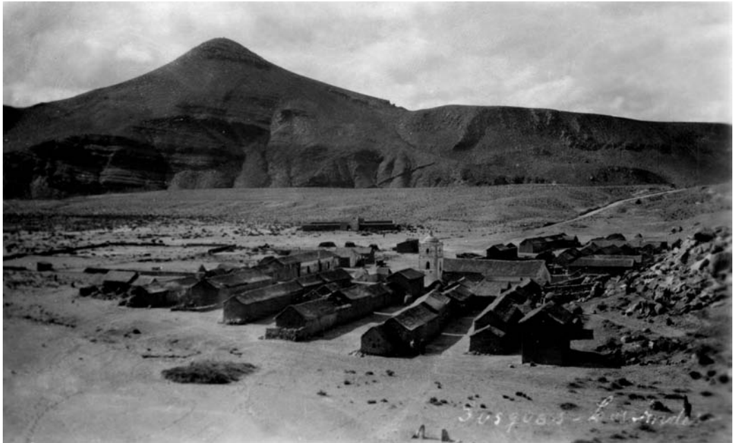
Figura 4. Tarjeta postal del pueblo de Susques, ca.1930-1940.