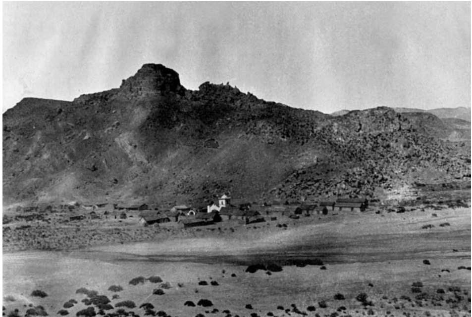
Figura 2. Fotografía de Susques en 1900 (Cerri, 1903).