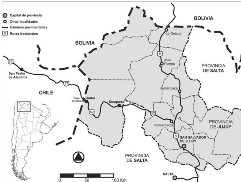
Figura 1. Ubicación de Susques dentro de la Provincia de Jujuy.