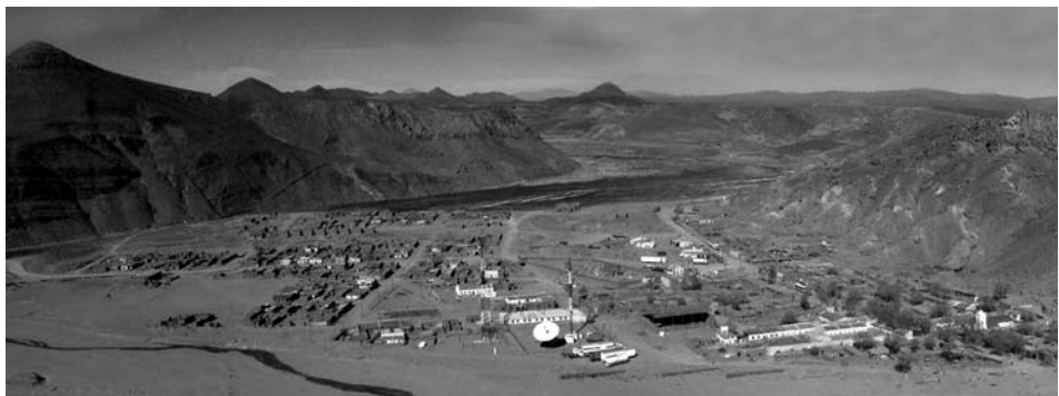
Figura 7. Panorama actual de Susques desde el norte.