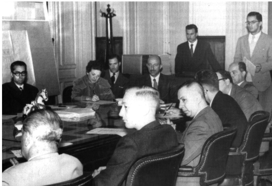
Figura 2: Reunión de docentes en el Encuentro de Docentes de Historia de la Arquitectura, Tucumán (1957). Fuente: Gutierrez, Paterlini y Trecco, 2007, p. 72.