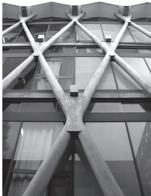
Figura 3: Publicación del edificio de la Facultad de Arquitectura de Mendoza.