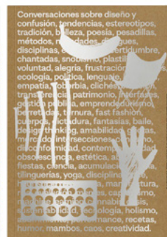
V3. 216 páginas. 2022 ISBN 9789878834559