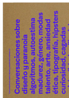
V2. 192 páginas. 2019 ISBN 9789877839159