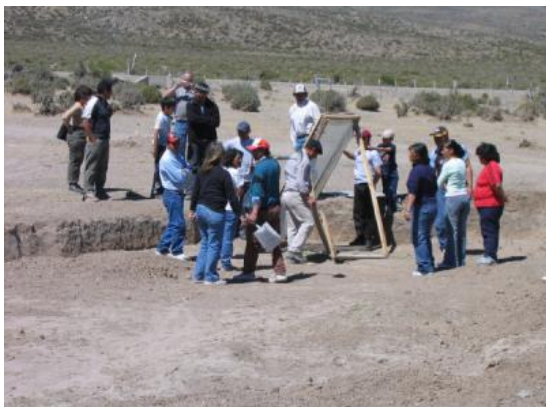
Figura 1. Los primeros pasos en Cushamen.

calefaccionar sus viviendas, elemento que es particularmente escaso en el medio rural y aislado donde viven.