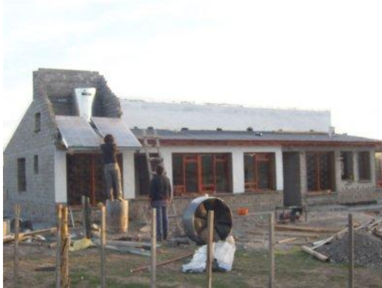
Figura 6. Vivienda construida con suelo cemento y estructura de H° A°. Instalación de colectores solares pasivos para agua caliente.

Esto permitió incorporar muros Trombe-Mitchel modificados, Figura 3, que incorporan una cámara de aire, con una pared de mampostería del lado interno, cerrada por una superficie vidriada exterior. En el lado interior se realizan pequeñas aberturas en la parte superior e inferior para permitir la circulación dentro del ambiente, ingresando el aire caliente y saliendo el frío, el cual adquiere nuevamente temperatura en su pasaje por la cámara acumuladora.