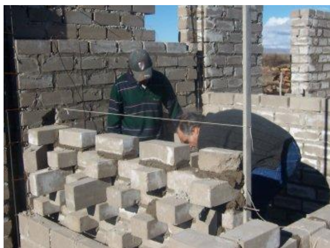
Figura 3. Construcción del muro acumulador solar Trombe-Michel con mampuestos de suelo cemento.

Esto significa capacitar a los pobladores en la técnica de ejecución de los mampuestos hasta las diferentes etapas constructivas que completan la ejecución de la vivienda. Se utilizan máquinas similares a la tradicional CINVA RAM, en este caso, de industria francesa marca ALTECH modelo GEO 50, Figura 2.