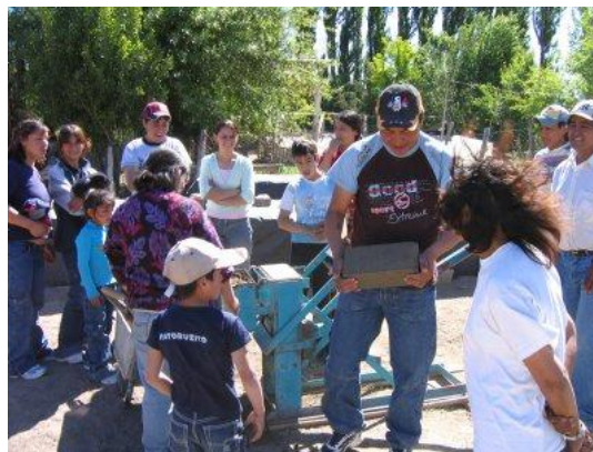
Figura 2. Capacitación en suelo cemento.