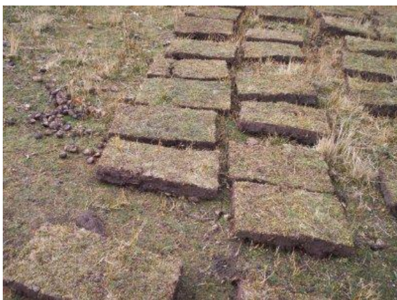
Figura 4. ‘Champas’, recorte del sustrato vegetal superficial de los mallines o ‘manantiales’.

Este hecho, mas el corto plazo que restaba para el inicio de la temporada invernal, determinó la búsqueda de material alternativo que disminuyera los plazos de construcción.