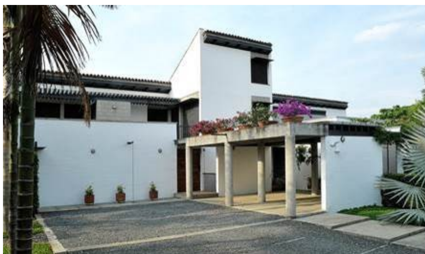
Figura 4. Casa de las aves, Jamundí, Cali.

Edificio San San Sanfernando , Cali. 3° 26’ 17” N, y a 992 msnm, 2007-2009 y 2015, Figura 5. Además de sus encalados muros de bloque de cemento rellenos con tierra estabilizada, en este caso se trató de mejorar la presencia de un alto muro medianero en patios, terrazas y balcones, integrándolos a dichos espacios, especialmente en el pequeño patio de los dos apartamentos en el semisótano, pintándolo con tierra ocre, y ya comienza a cubrirse de vegetación,