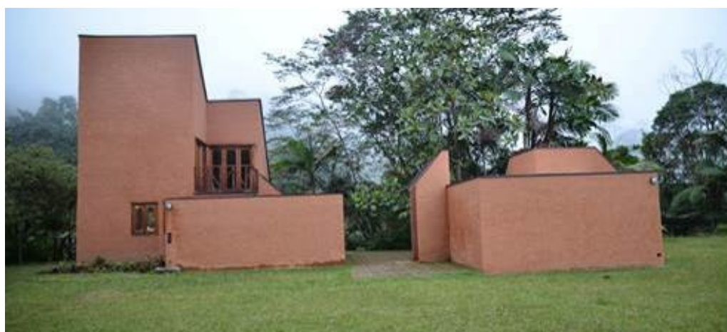
Figura 8. Casa del sietecuecos, Cali.

Casa del sietecuecos. Cali, K. 25, salida al mar, 3°, 29'50" N, y a 1.800 msnm. 2017, Figura 8. Buscando reintegrar algunos elementos que fueron arbitrariamente modificados por su constructor inicial en 1980, se decidió recubrir sus muros de ladrillo visto, de color mas rosado que rojo, reemplazándolos por bloques grises de cemento del proyecto original, con tierra del lugar, color siena oscuro. Así, no se alteró la imagen 'roja' que ya había adquirido la casa, pero haciéndola mas partícipe de su entorno, en el que aun se encuentran construcciones vernáculas de tierra y muchas cubiertas de teja de barro.