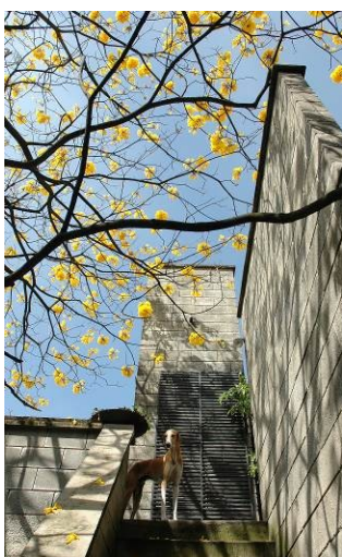
Figura 3. Casa de la queja

Casa de las aves . Jamundí, al sur de Cali, 3° 15’ 56” N, y a 983 msnm. 2008, Figura 4. La casa es larga en el sentido del sol y sus cubiertas inclinadas de tejas de barro dan inercia térmica, igual que los muros rellenos con tierra y sombreados por aleros y tejadillos. Las aberturas bajo la cubierta evacuan el aire caliente. Las ventanas, sin vidrios, y los calados, facilitan el paso del aire y las celosías dan privacidad y seguridad. Su construcción usó materiales naturales y poca energía. La ropa se seca al aire y al sol. La basura orgánica se recicla para compost para el jardín.