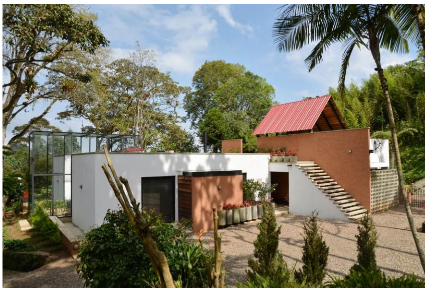
Figura 6. Casa AD-EX, Cali.

Casa AD-EX. K. 17, Salida al mar, Cali, 3°, 29'50" N, y a 1.785 msnm. 2011, Figura 6. En esta remodelación se recubrieron con tierra del mismo sitio casi todos los muros que encierran los cuatro patios laterales nuevos, y un alto muro que remata la circulación de entrada a la casa que separa la parte destinada al agregado, buscando un contraste con los muros existentes que se conservaron, la mayoría blancos, pero ahora encalados. El color siena oscuro de la tierra empleada contrasta con un paisaje de montañas lejanas y un bosque tropical húmedo, cubierto muchos días de densa niebla.