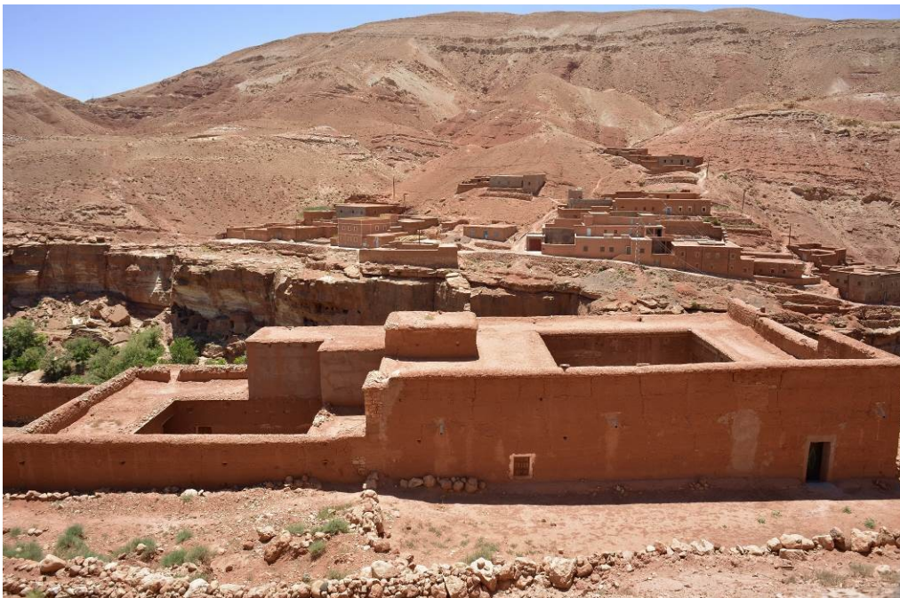
Figura 2. Vivienda de adobe en Marruecos.

Adobes: son muros menos gruesos que los de tapia, de 0.20 a 0.40 ms. y una técnica tan vieja como la arquitectura occidental, pero igual los hay en las construcciones incas en el Valle de Rimac, y en las preincaicas de Chan Chan, Paramoga y Pachacamac ( Losada, 1988, p. 2 ). La palabra, de origen árabe, adoptada en España e Iberoamérica ( Dethier, 1983, p. 57 ), designa al ladrillo ‘crudo’, hecho al pie de obra y pegado con barro.