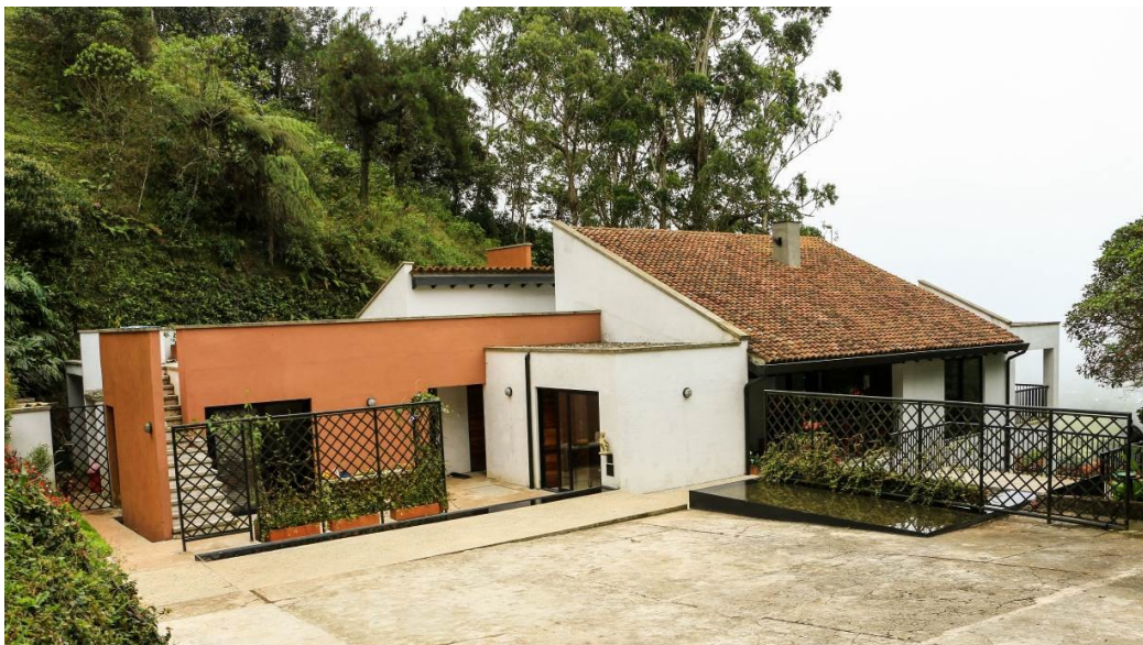
Figura 7. Casa de la montaña, Cali.

acústicamente, que permiten ventanas altas abiertas al cielo, la luna y los pájaros, y entrar el sol al atardecer calentando los ambientes antes de la fría y oscura noche que llega.