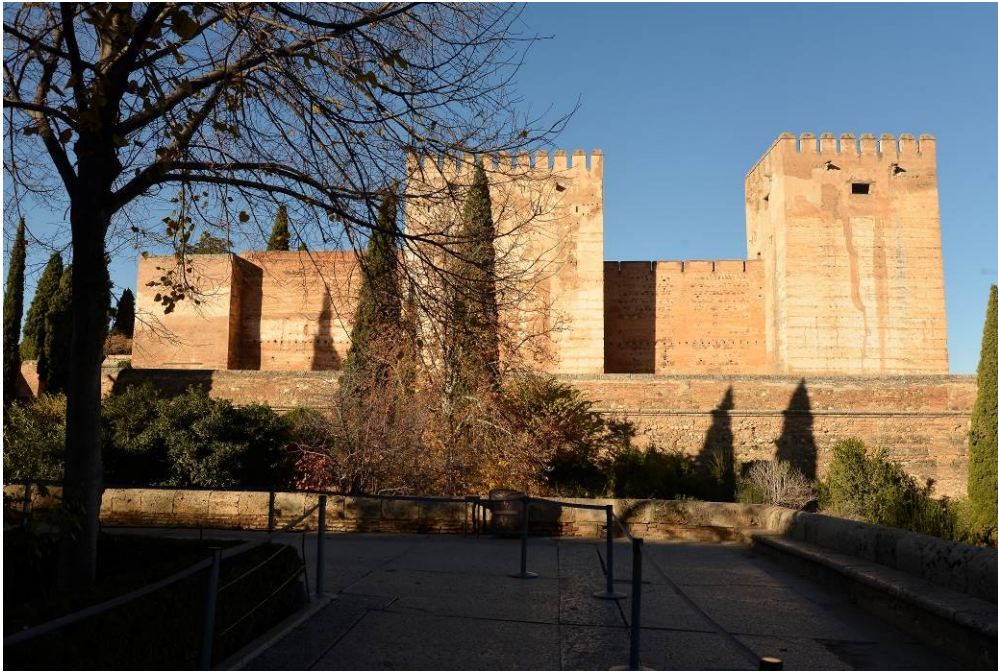
Figura 1. Torres de tapia pisada, La Alhambra, Granada, España, Siglos XVIII a XV.