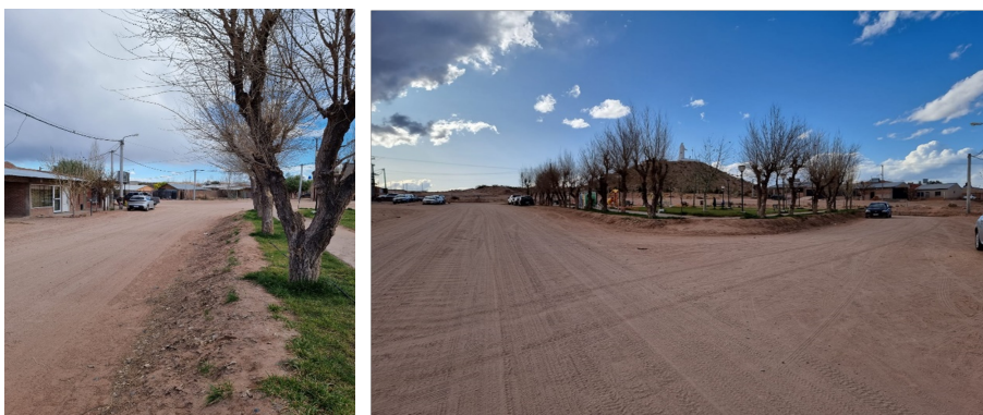
Figure 2: Peatonales en el sector de interés aledaño a Plaza Favaloro