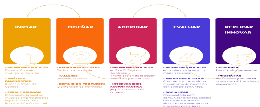
Figure 3: Síntesis de la propuesta de implementación diseñada.